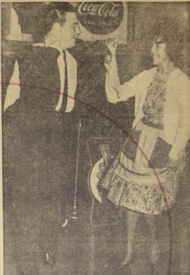
● EN EL LICEO FRANCES se realizó un simpático y animado baile, y en él nuestra típica cueca tuvo entusiastas intérpretes.