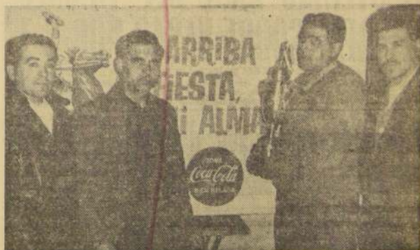
● EN LA COMPAÑIA DE CONSUMIDORES DE GAS de Santiago, dirigentes del Club de la Empresa reciben la Copa Coca-Cola, disputada en un interesante torneo de baby-fútbol.