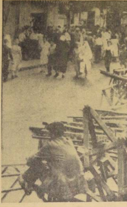
ARGENTIA.— Las famosas tiendas árabes de esta ciudad fueron desmanteladas y los cabaleros quedaron al desnudo, cuando los comerciantes árabes resistieron cerrar sus negocios en protesta por los recientes atentados de que fueron víctimas de parte de los residentes europeos.