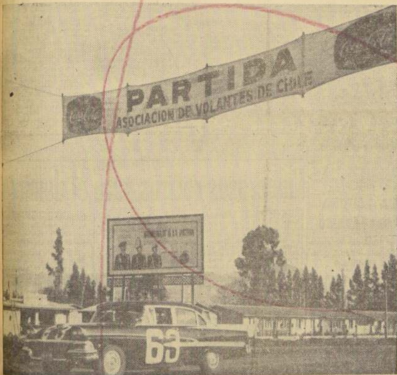
● EN NOS se dio la largada al Gran Premio de Regularidad Automovilística 1961, Nos. Parral-Catillo.