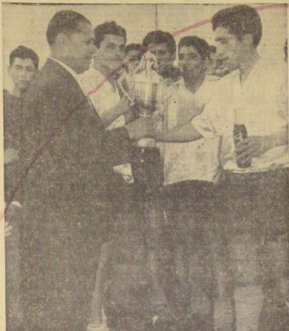
● EN SAN MIGUEL, el capitán del equipo Santa Ana, de esa comuna, recibe la Copa Coca-Cola, luego de ganar el torneo de Fiestas Patrias.