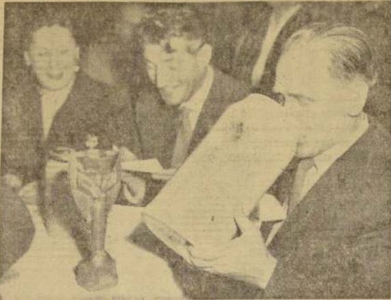
¡SALUD! Sepp Herberger aparece habiendo un jarro de cerveza, en uno de los asajos por el triunfo de Suiza. Sobre la mesa está la Copa Jules Rimet. Al lado del "mago", a la izquierda, está el capitán de la selección alemana, Fritz Walter.

Herberger lleva más de 25 años a cargo del cuadro alemán. Será el "decano" de los coaches que vendrán al Mundial del 62.