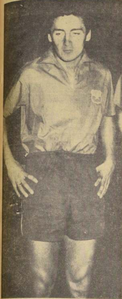
MARIO MORENO— Conjunción de virtudes en las que el talento y la habilidad futbolística son sus expresiones más destacadas.