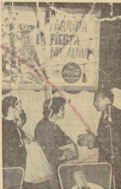
● EN EL SINDICATO INDUSTRIAL VESTEX se entregaron los premios a los vencedores de las diversas competencias de celebración de Fiestas Patrias.