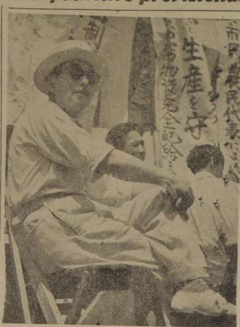
El pueblo con hambre es fácil presa de los propagandistas que proclaman promesas de una vida mejor. Sanzo Nozaka, Secretario General del Partido Comunista japonés, aprovecha toda oportunidad para subir a una plataforma y decir a sus compatriotas, que las cosas andan mejor en la Unión Soviética. Aquí vemos a Nozaka esperando su turno para hacer uso de la palabra.—(Foto ACME).

BRUSELAS, 8 (UP).—Más de 20.000 obreros de la industria del acero se declararon en huelga hoy en el distrito de Lieja, en apoyo de sus demandas de que se les dé una mayor cantidad de las utilidades de las empresas en que trabajan, como gratificación anual.