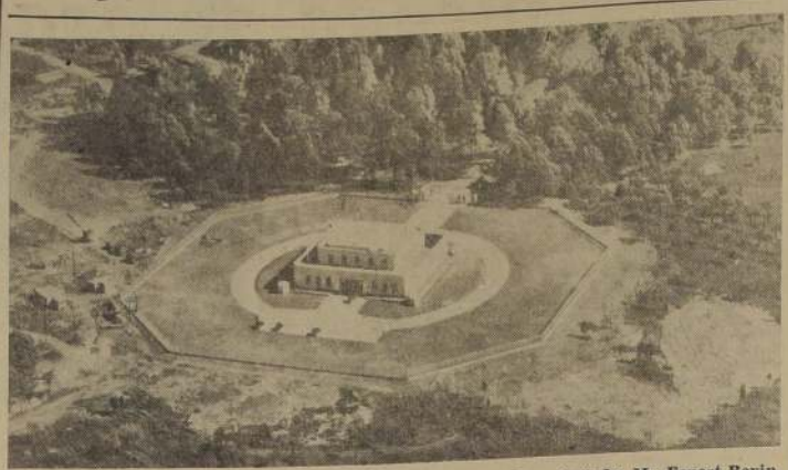
FORT KNOX. — El Secretario de Relaciones Exteriores de Gran Bretaña, Mr. Ernest Bevin, recibió recientemente que Estados Unidos redistribuya el oro depositado en Fort Knox, en la forma de las formas más seguras de restaurar la economía mundial. La foto nos muestra el famoso edificio de Fort Knox, donde está depositado el oro de la nación.