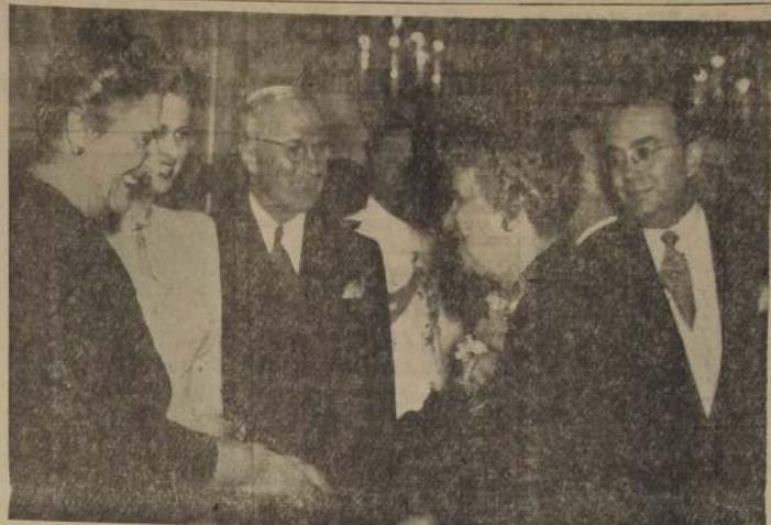
Las recepciones de Truman y Estados Unidos, de parte con gran cordialidad durante una eficiente recepción en el Palacio Catete, de Río de Janeiro. En el centro se advierte al Presidente Truman.

Todos los diarios destacan y repudian los bochornosos sucesos de ayer en los campos de Independiente y River Plate.