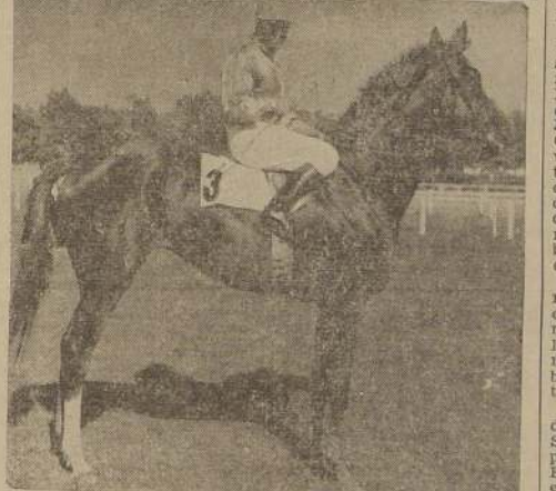
La mejor yegua de nuestras pistas, ganadora de "El Derby" y "Las Oaks" y $ 427.874, proviene también de la República Argentina, habiendo completado su crianza en el Haras "Aconcagua".