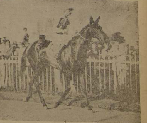
Por Meadow y Cana, que ganó en empate con Quisquillosa, la Polla de Potranzas. Hermana paterna de Mamba y materna de Comunera, ambas corriendo en nuestras pistas.