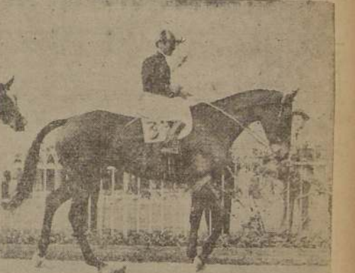
Por Full Sall y Quilma, empató con Cancagua la "Polla de Potranzas", disputada en Palermo.