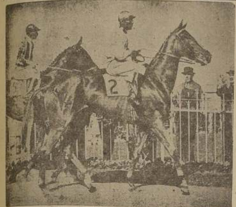
Se clasificó como la mejor hembra de tres años al hacer suyo el clásico "Selección", que equivale a nuestras "Oaks".