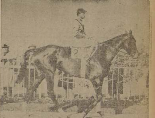
Hija de Parlanchin y Silver Legend, compartió el triunfo con Blackie en el "Gran Premio de Honor", sobre 3,500 metros. A juicio de los entendidos fué la más completa de las dos, ya que ganó en toda distancia.