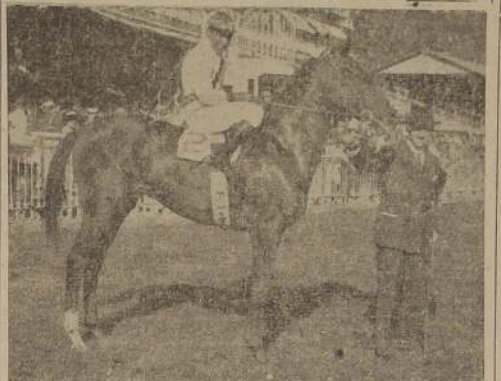
El mejor caballo actualmente en training y crack de nuestras pistas, ganador de "El Derby", numerosos clásicos y $ 842.470 en premios, fué importado de la República Argentina por el Haras "Aconcagua", en donde completó su crianza.