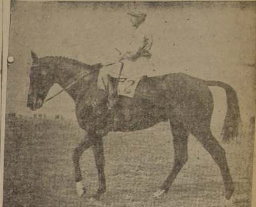
Por Rustum Pashá y West Paint, se consagró el mejor stayer al hacer suyo los 4,000 metros del clásico "General Pueyrredón". Zagal, ganador clásico, y Jali, la revelación del año pasado en nuestras pistas, son también hijos de Rustum Pashá.