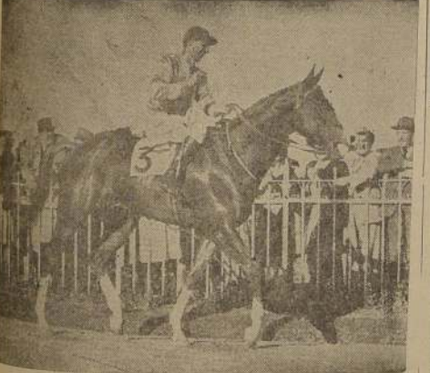
Hijo de Rustum Pashá y Añapa, se adjudicó la "Polla de Potrillos".