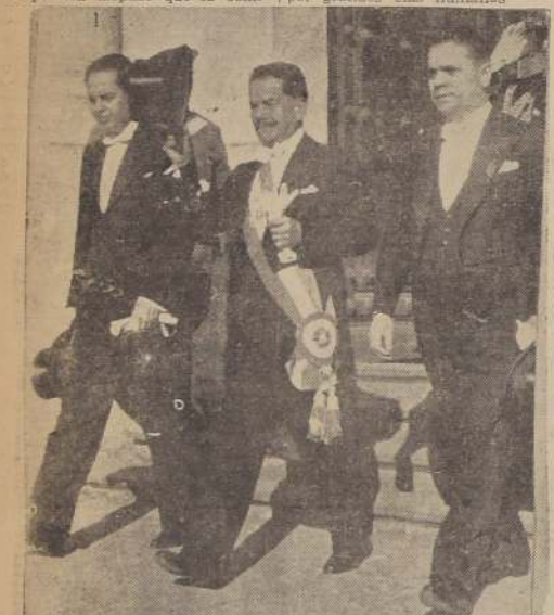
El Excmo. señor Aguirre Cerda, acompañado del Ministro del Interior, señor Alfonso, y del de Relaciones, señor Ortega, sale de la Moneda para dirigirse al Congreso.

dades en el siguiente orden: marinería norteamericana, 1.ª, 2.ª, 3.ª, 4.ª, 5.ª, 6.ª, 7.ª, 8.ª, 9.ª, 10.ª, 11.ª, 12.ª, 13.ª, 14.ª, 15.ª, 16.ª, 17.ª, 18.ª, 19.ª, 20.ª, 21.ª, 22.ª, 23.ª, 24.ª, 25.ª, 26.ª, 27.ª, 28.ª, 29.ª, 30.ª, 31.ª, 32.ª, 33.ª, 34.ª, 35.ª, 36.ª, 37.ª, 38.ª, 39.ª, 40.ª, 41.ª, 42.ª, 43.ª, 44.ª, 45.ª, 46.ª, 47.ª, 48.ª, 49.ª, 50.ª, 51.ª, 52.ª, 53.ª, 54.ª, 55.ª, 56.ª, 57.ª, 58.ª, 59.ª, 60.ª, 61.ª, 62.ª, 63.ª, 64.ª, 65.ª, 66.ª, 67.ª, 68.ª, 69.ª, 70.ª, 71.ª, 72.ª, 73.ª, 74.ª, 75.ª, 76.ª, 77.ª, 78.ª, 79.ª, 80.ª, 81.ª, 82.ª, 83.ª, 84.ª, 85.ª, 86.ª, 87.ª, 88.ª, 89.ª, 90.ª, 91.ª, 92.ª, 93.ª, 94.ª, 95.ª, 96.ª, 97.ª, 98.ª, 99.ª, 100.ª.