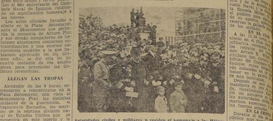
Autoridades civiles y militares y residen el homenaje a los Héroes de Iquique

Las tropas, la Escuela Naval, la delegación de la Escuela Militar y la marinería de los buques norteamericanos hicieron una brillante presentación HOMENAJE A LOS HEROES