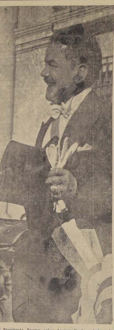
El Presidente, Excmo. señor Aguirre Cerda, saluda a la multitud que lo aclama.

EL FESTIVAL DE BANDAS MILITARES. — El festival de bandas militares efectuado anoche a las 12 horas en la Plaza Bulnes, congregó un público numerosísimo que escuchó con agrado y aplauso, con entusiasmo el selecto programa ejecutado.