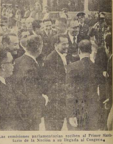
Las comisiones parlamentarias reciben al Primer Mandatario de la Nación a su llegada al Congreso.