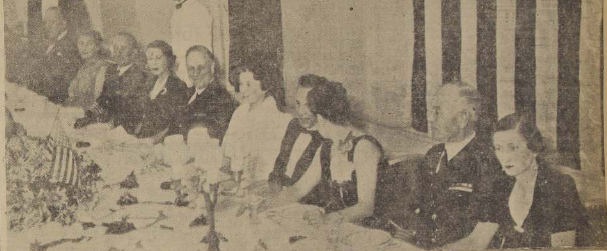
Aspecto de la mesa de honor durante la comida ofrecida anteanoche en los comedores del Crillon por la American Association Women, en honor de los marinos norteamericanos.