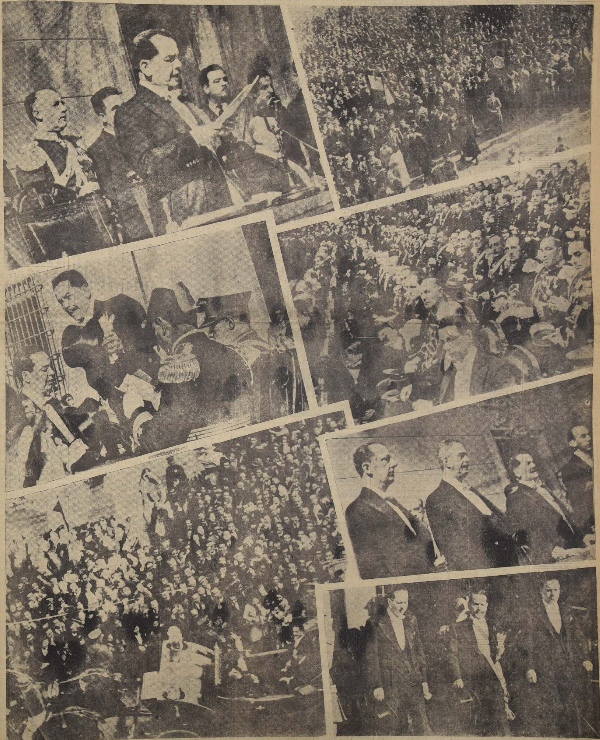
Diversos aspectos de la tradicional ceremonia de apertura del período ordinario de sesiones del Congreso Nacional, que constituyó una vibrante demostración de adhesión a la política de Frente Popular del Gobierno y a la persona del Excmo. señor Pedro Aguirre Cerda