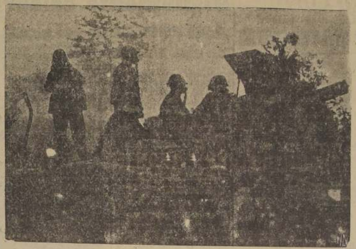
Soldados suizos previstos de mineras contra gases asfixiantes, manejan un cañón de campaña durante la reciente maniobra realizada por el país de los Alpes. El Gobierno ha dispuesto que todos los caminos y puentes del territorio suizo en la frontera suiza-alemana sean minados y que las tropas se hallen preparadas a hacer frente a cualquiera amenaza del exterior.