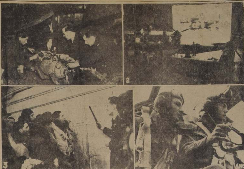
Las formidables incursiones de bombarderos británicos contra las ciudades alemanas demuestran que la superioridad aérea en el continente corresponde a la Real Fuerza Aérea, no sólo por el número de aparatos y pilotos, sino por la precisión de estos y la perfección de aquéllos, así como por la exactitud de los planes forjados para asestar al enemigo golpes irreparables en sus fuentes de producción bélica y en sus concentraciones militares. La aviación británica actúa, además, en otros frentes, de los cuales no es el menos importante el de Libia, donde la acción aérea tiene primordial importancia para la marcha de la guerra.