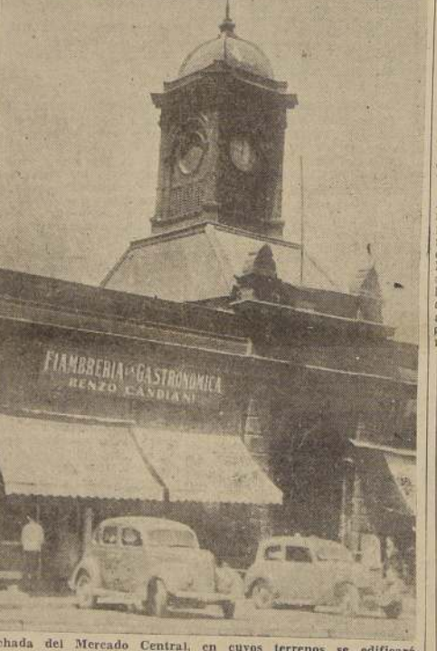
Fachada del Mercado Central, en cuyos terrenos se edificará el Palacio del Correo de Santiago.