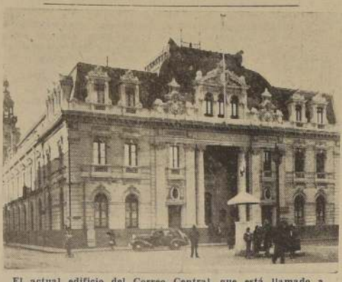
El actual edificio del Correo Central, que está llamado a desaparecer.

Para el Centro Primario de Inca de Oro (Atacama) con renta de $ 2.400 MENSUALES, más 25.000 gratificación.