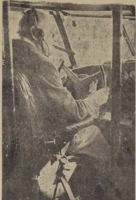
Mr. Churchill conduce personalmente el avión que lo trasladó a América, para celebrar una de sus importantes entrevistas con el Presidente Roosevelt. En la que celebrarán ambos dirigentes en Quebec, se habrá de tomar acuerdos decisivos para acelerar la caída total del Eje.

El Gabinete de Guerra se reunió en el Hotel Chateau Frontenac.