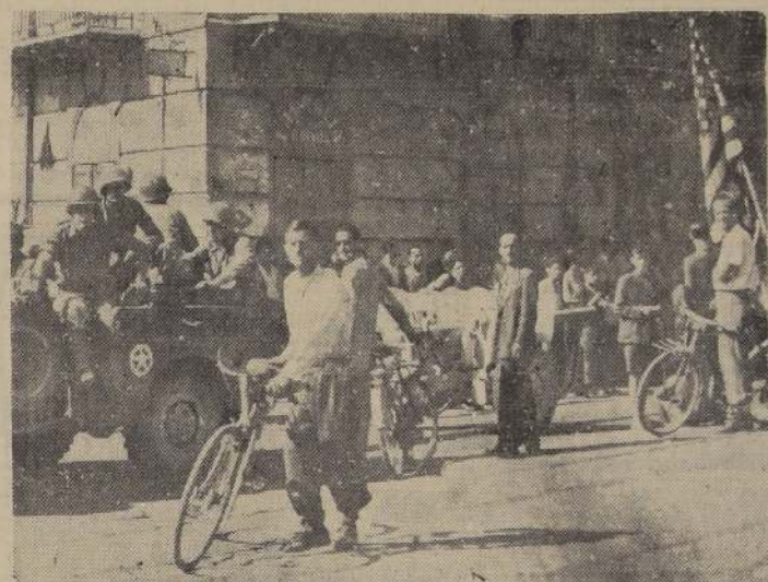
Vista tomada en Palermo, la capital de Sicilia, a la llegada de las fuerzas norteamericanas, que fueron recibidas cordialmente por su población.