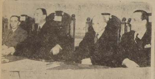
Los Embajadores de Gran Bretaña y Estados Unidos durante la repartición de premios en la Sociedad de Fomento Fabril.

FUERON AGRACIADAS LAS PERSONAS E INSTITUCIONES QUE CONTRIBUYERON AL ÉXITO DE LA EXPOSICIÓN INDUSTRIAL