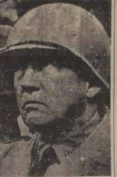
El general Patch, que avanza en forma arrolladora en el reducto de Baviera

Mientras la infantería, la artillería y los tanques cruzaban los puentes sobre el Sprea hacia Dresden y Dessau, los cazacos del Don se dedicaban a