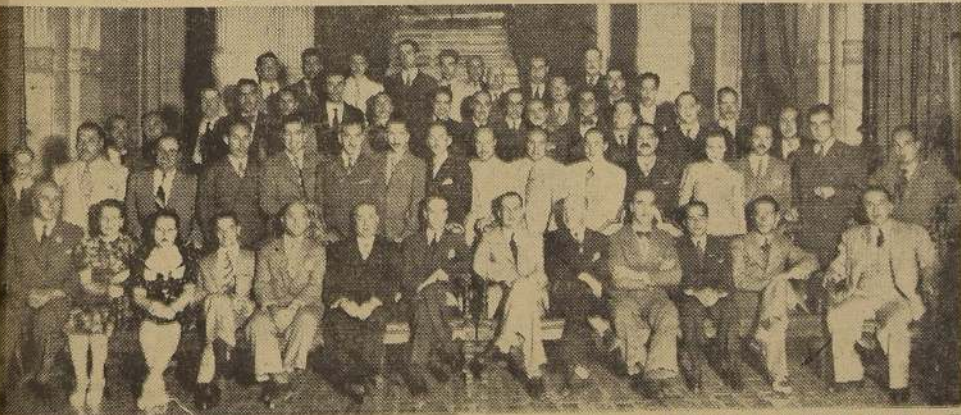
Manifestación ofrecida a las delegaciones participantes en el Congreso Panamericano de Basketball, en el Palacio Cousiño. — Un espléndido buffet fué servido por la Confitaría LUCERNA.