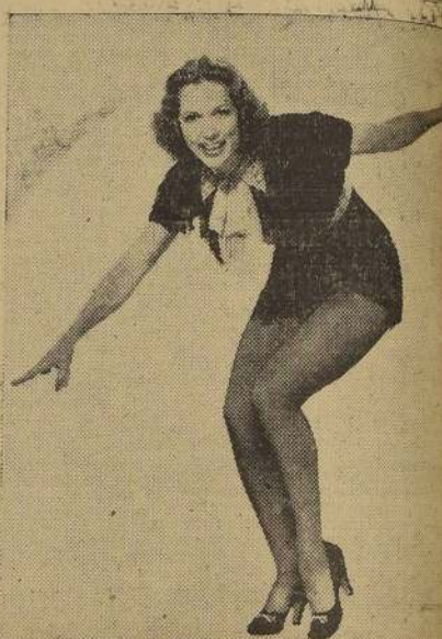
Eleanor Powell, con su cuerpo maravilloso y su ritmo de bailarina, encarna su mejor rol en esta nueva comedia de la Metro Goldwyn Mayer.