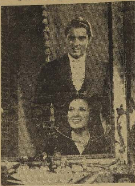
En fecha próxima será estrenada en nuestras pantallas, una de las producciones cinematográficas de más colorido relieve de la temporada, la obra de Blasco Ibañez traspasada al lienzo, y que protagoniza Tyrone Power.