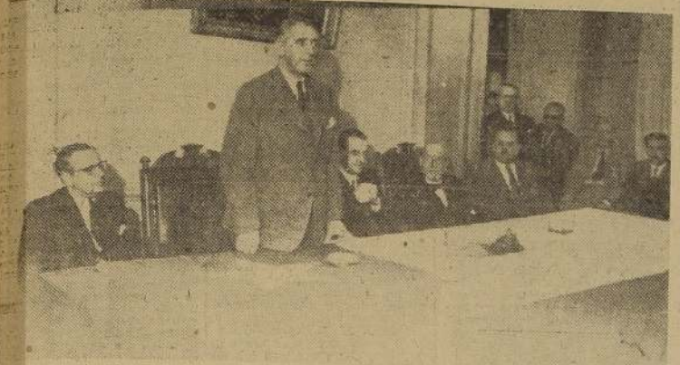
El Presidente Electo, don Juan Antonio Ríos, hace uso de la palabra durante la sesión de ayer, de la Sociedad Nacional de Minería

El Presidente Electo de la República se refirió a la necesidad de arbitrar medidas tendientes a crear en el país una riqueza minera grande y estable