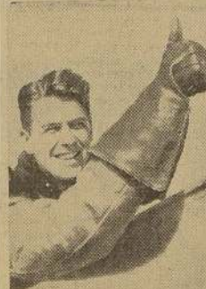
RONALD REAGAN, principal protagonista del film "Escuadrilla Internacional"

Ronald Reagan, el joven actor que ha sobresalido en varias producciones que destacaron por su acción dinámica, interpreta "Escuadrilla Internacional". El rol básico, los diálogos, los acrobacias, en forma unánime, fueron el trabajo de Reagan, uno de los más perfectos y seguros que en este film el actor consiguió su consagración en forma definitiva. Lo segundo un repertorio de eficientes artistas.