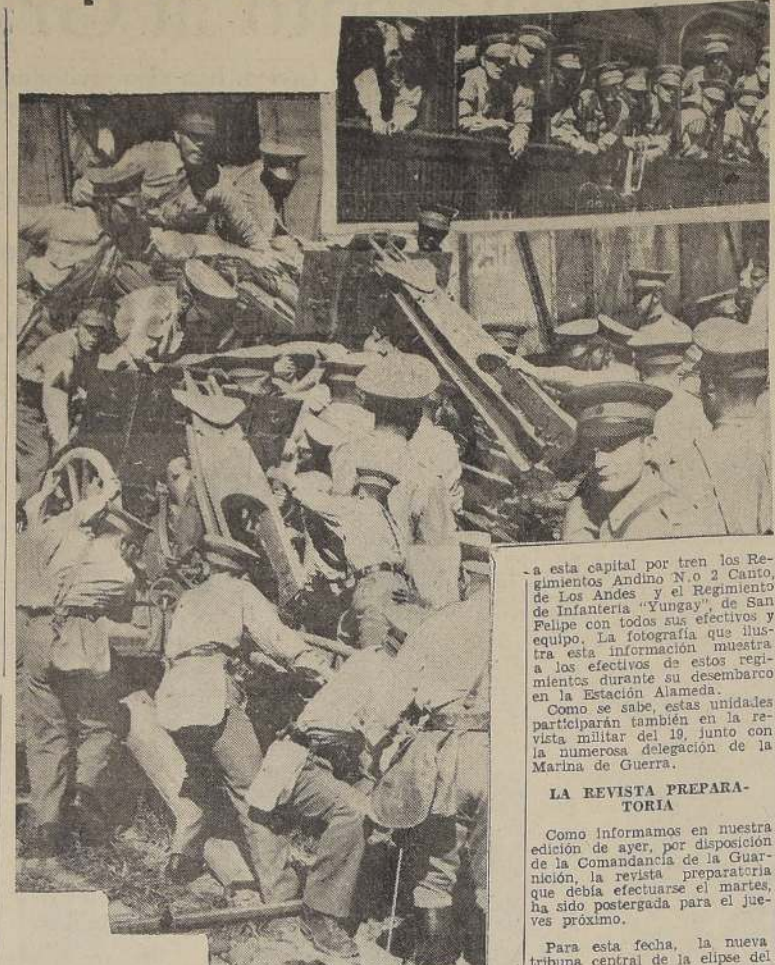
Algunas escenas de la llegada de los Regimientos "Canto" y "Yungay" a Santiago

Policia Siete horas después de cometido un robo de joyas por $ 17.000 la policía logró detener al ladrón