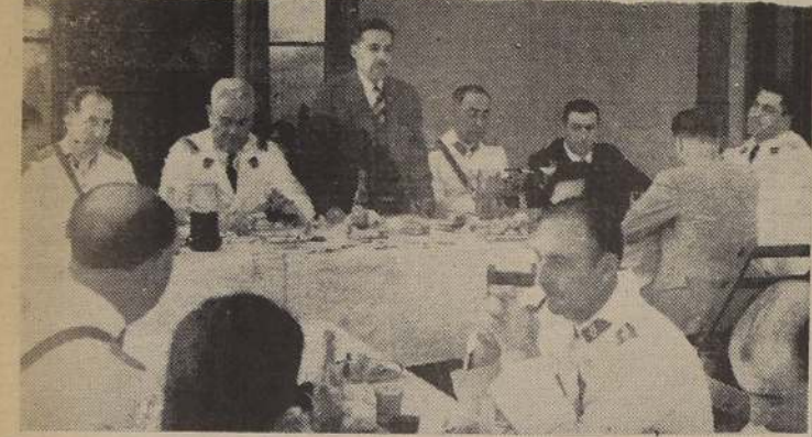
El Ministro del Interior don Arturo Olavarría, haciendo uso de la palabra durante el almuerzo de ayer en la Escuela de Caballería.

Ochocientos hombres desfilaron ante el señor Olavarría. — Almorzó en la unidad, acompañado de comandantes de Ejército y de carabineros