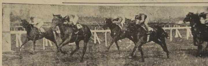
Carmita sale de perdedores sobre Balambarasi, Mostaza y Victorio en la 2.a carrera de la tarde.

Al enfrentar las galerías, Malayo logró desprenderse de Milagro, pero allí cayó sobre el Leicester, el que, descontento el claro que lo separaba del favorito, logró emparejarse en los