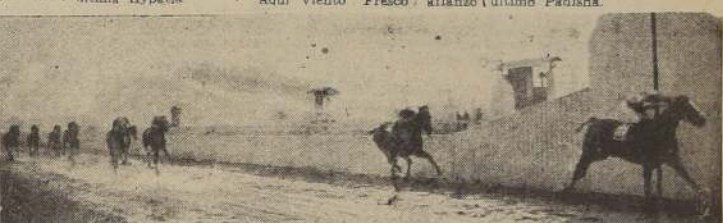
Viento Fresco delante de Rana, Admirador y Pichonga, en la penúltima.

El segundo puesto lo conservó Islandia delante de Don Teo, que avanzó débilmente al final; cuarta All Right, que en ningún momento evidenció interés por el premio Penúltima Salacia y último Padisha.