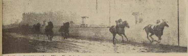
Funiculi se impone sobre Miss X, Crispín y Katiushka, en la mejor serie de los compromisos handicaps.