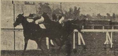
Ninhue aventaja a Piduco, Mayoral y Sir Lucius, en la tercera.

los primeros tramos de la recta. Poseción cayó sobre la puntera, y exigida por su jockey, logró dominarla, para llegar a la raya cuando la aventaja por tres cuartos de cuerpo. El tercer lugar, a dos largos, lo correspondió a Distinguida, delante de Papi Papi, Quinto Triana, sexto, Samaniego; séptimo, Amarrilla, Penúltimo, Guelidi, y última Andina.