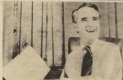
WASHINGTON. El senador Thomas Eagleton, hoy en un libro sobre los presidentes norteamericanos, antes de la decisiva reunión con el Candidato Presidencial del Partido Demócrata, George McGovern, en que renunciara como candidato a Vice-Presidente.

Peterson declaró que dependerá de las decisiones políticas, que tomarán los más altos dirigentes de los dos países, la posibilidad de llegar a un acuerdo comercial entre la Unión Soviética y Estados Unidos.