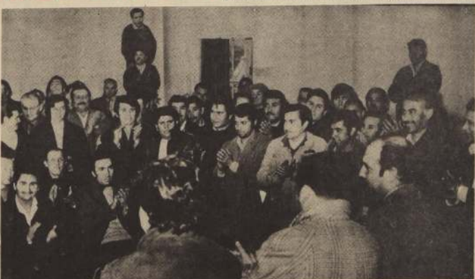
PERSONALMENTE, EL MINISTRO DE ECONOMIA, CARLOS MAIUS, concurre hasta las distintas plantas de la Compañía de Consumidores de Gas, GASCO, para informar a los trabajadores de la medida adoptada por el Gobierno y que tiende a normalizar la distribución de gas licuado en la zona central, así como asegurar la estabilidad laboral de obreros y empleados.

Desde hace un par de meses, los hogares de la zona central habían sentido, en carne propia, los serios problemas creados por el abastecimiento de gas licuado. En diversas oportunidades los trabajadores de GASCO habían culpado a los ejecutivos de esta empresa de ser los causantes directos de este grave problema, señalando que, sistemáticamente, se habían negado a adoptar medidas para evitar los problemas de abastecimiento que se dejarían sentir en toda la población en los meses de invierno.