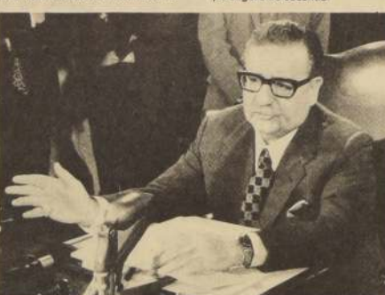
En el año 1940, siendo Ministro de Salud, Salvador Allende comenzó a luchar por la ley previsual para los trabajadores chilenos, los mismos que más tarde lo eligieron presidente de la República

Sin embargo, la lucha no había terminado. La clase obrera organizada ya en la Central Única de Trabajadores, los partidos de izquierda y el propio senador Allende, como principal impulsor, consiguieron la inclusión posterior en los beneficios del SSS, los aspectos relativos a los accidentes del trabajo y a seguro de cesantía.