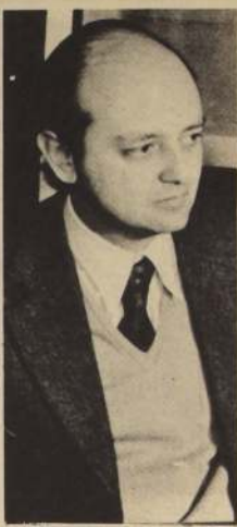
Subsecretario de Justicia, José Antonio Viera Galló.

Consultados los trabajadores sobre los proyectos del Ejecutivo señalaron que estaban ciento por ciento de acuerdo con la presentación y los conceptos en ella expresados, pero pidieron tiempo para estudiar en detalle los proyectos a fin de pronunciarse objetivamente sobre el particular.