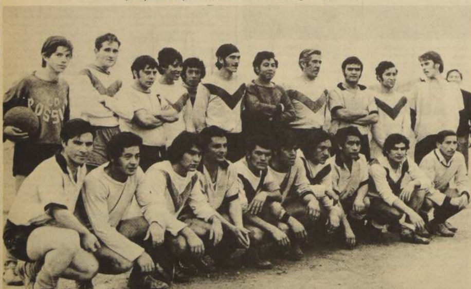
Dejando momentáneamente de lado sus diferencias dentro del campo de juego y su calidad de adversarios en la 10a. fecha del Torneo Oficial de la Asociación