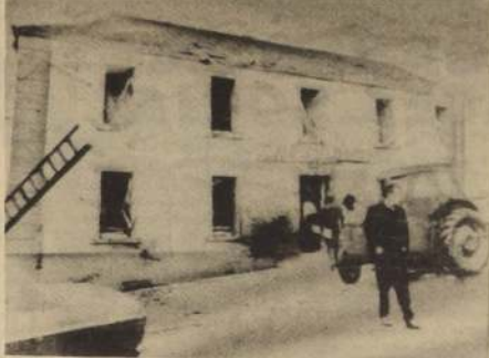
LONDON DERRY. Irlanda del Norte. Hotel Beaufort, que fuera dañado por la explosión de tres bombas que tuvo lugar en la localidad de Claudy, resultado de la muerte de seis personas y otras 32 heridas.

Los dirigentes del aeropuerto de Argel difundieron la noticia de la llegada del avión. El DC-8 aterrizó a las 07.00 GMT.