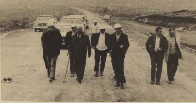
El Ministro Pascual Barraza visitó el camino de acceso al túnel de Chacabuco que se inaugura el próximo martes.

Citase a los socios a Asamblea General Extraordinaria para el 8 de Agosto próximo, a las 18.15 horas, a realizarse en los respectivos lugares de la Inspección del Trabajo o lugares de trabajo según las disponibilidades de La Serena, Santiago, Valparaíso, Talca, Chillán, Talcahuano, Los Angeles, Temuco y Osorno, para proceder a la elección del nuevo Directorio, en cumplimiento de los estatutos y disposiciones vigentes. LA DIRECTIVA