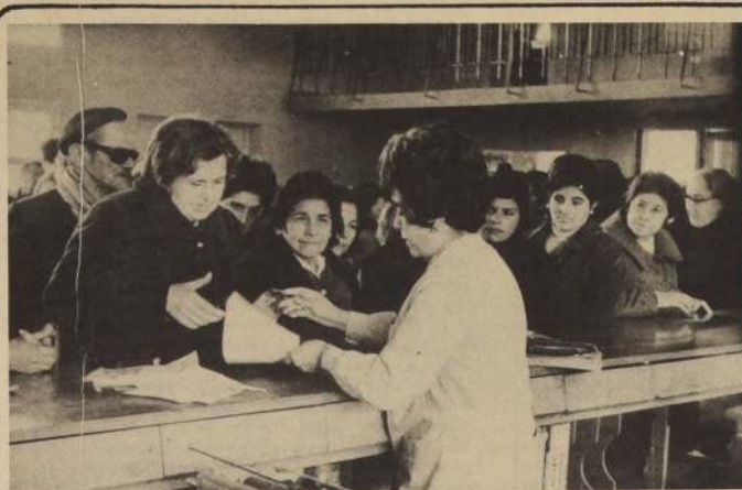
TRABAJO VOLUNTARIO EN EL SSS. Se paga a pensionados en la agencia local de Maipú un día sábado. Una funcionaria identifica a los asegurados como paso previo para cancelar su pensión. En el