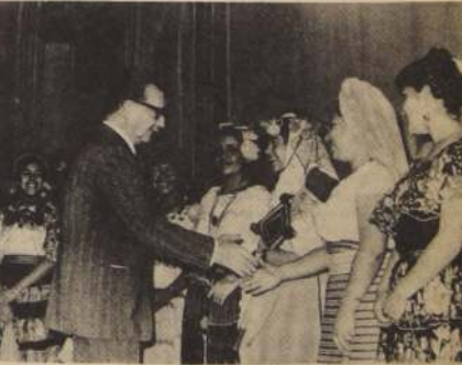
NOVENIA JOVENES que integran la Embajada Juventud, Arte y Cultura de Chile, enviados por el Presidente de este país y que permanecerán durante una semana en Chile ofreciendo recitales a los trabajadores y jóvenes chilenos, fueron recibidos por el Presidente Salvador Allende, ayer al mediodía. Luego de entregarle varios obsequios, interpretaron canciones del folclore mexicano, que fueron calurosamente aplaudidas por el Primer Mandatario. EN LA FOTO, el Presidente Allende saluda a las jóvenes, entre las cuales se encontraban siete ahijadas suyas.