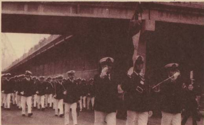
El próximo viernes circulará en Valparaíso el sello postal del Sesquicentenario de la Escuela Naval, que tendrá en su efigie la figura del Buque-escuela "Esmeralda" que actualmente navega de regreso a nuestro país. En el grabado, vemos al batallón de presentación del barco, durante su paso por las calles céntricas de Sidney, Australia, donde fue objeto de especiales homenajes.

En la Escuela Naval antigua, que se encuentra en el Paseo 21 de Mayo, frente al ascensor Artillería, se desarrollarán otros actos y competencias deportivas acuáticas y de fútbol.