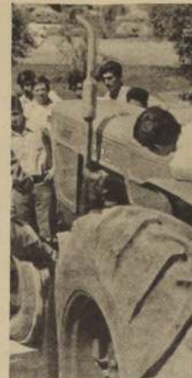
LA PREPARACION DEL CAMPESINADO en el manejo y mantenimiento de tractores, es uno de los principales pasos para llegar a la mecanización del agro, y, consecuentemente, ganar la batalla de la producción.

cada uno, una jornada de tres semanas y otra de instrucción completa que significa el preparar 900 alumnos por mes. En la realización de estos cursos, las organizaciones campesinas tienen decisiva responsabilidad. A ellas corresponde despertar en los trabajadores la conciencia responsable de participar, seleccionar a los candidatos y promover estos programas a nivel comunal. Las organizaciones campesinas están realizando en este aspecto una destacada labor: las confederaciones "Rancagua", "Trunfo Campesino", "Libertad" y de Asentamientos, han comprendido el esfuerzo de CORA y en conjunto permitirán que Chile se autoabastezca.