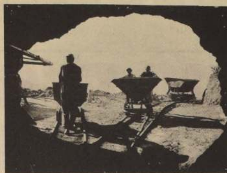
AL DURO TRABAJO MINERO también se agregan las inclemencias del tiempo, que no pueden detener el incesante trabajo minero.

En relación a Estados Unidos, el Ministro aclaró que, sólo se ha aceptado al contratarse créditos con empresas bancarias, someter dichos créditos a los tribunales locales.