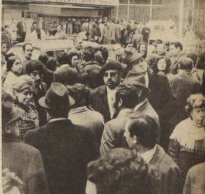
DESCONCIERTO, angustia e ira reflejan los rostros que miran anhelantes o desesperanzados hacia el segundo piso de la Caja de Previsión de los Empleados Particulares, donde un grupo, que cobró su sueldo puntualmente, creó un problema artificial de "toma" de edificio, para atornillar hacia atrás.

Desconcierto, angustia e ira reflejan los rostros que miran anhelantes o desesperanzados hacia el segundo piso de la Caja de Previsión de los Empleados Particulares, donde un grupo, que cobró su sueldo puntualmente, creó un problema artificial de "toma" de edificio, para atornillar hacia atrás.