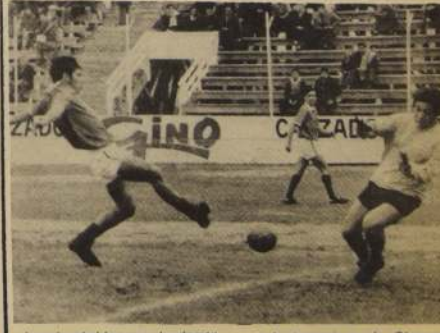
La velocidad fue arma fundamen-