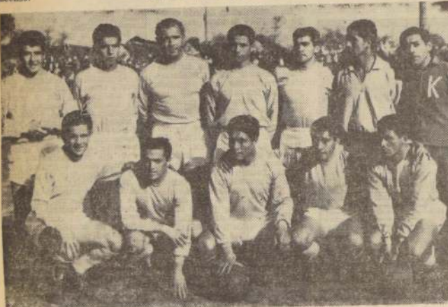
MUNICIPAL. Temó a su cargo la administración del Estadio Militar, escenario en el que se inició el torneo de segunda división, con buena asistencia. El equipo capitaneado por debutó con éxito, ya que perdió ante San

Antonio. Pero habrá de mejorar. Forman el team de Municipal: Arroyo; Beltrán, González y Vega; Parra y Uribe; Velásquez. Cueros, Sierra, Guerrero y Reyes.