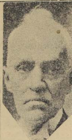
DON JUAN B. PÉREZ

El Presidente constitucional es el doctor Juan Bautista Pérez, sucesor del general Juan Vicente Gómez, que actualmente desempeña la Comandancia en Jefe del Ejército.