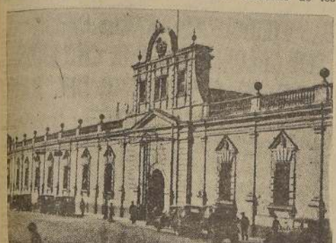
La antigua casa de Pizarro, hoy sede oficial de los Presidentes del Perú

LIMA, 20 (U. P.). El Presidente Benavides recibió visitas y felicitaciones en el Palacio de Gobierno de los