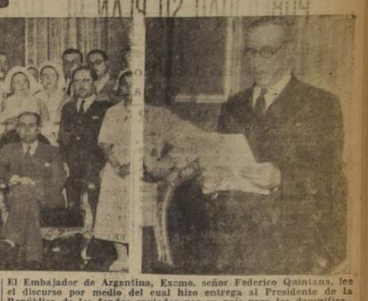
El Embajador de Argentina, Excmo. señor Federico Quintana, lee el discurso por medio del cual hizo entrega al Presidente de la República de los fondos enviados por su país para los damnificados del Sur.

PREPARATIVOS DEL "DIA DE LOS ESPECTACULOS" Ya se han iniciado los preparativos del primer día de la Semana Nacional. Al efecto se ha citado para hoy, a las 11 horas, en el local de la Comisión Nacional, a los dirigentes de espectáculos, teatrales y cinematográficos, para estudiar con ellos la forma de que las utilidades de las funciones del día 27, se destinen para los damnificados, sin mayor recargo para el público en las entradas.