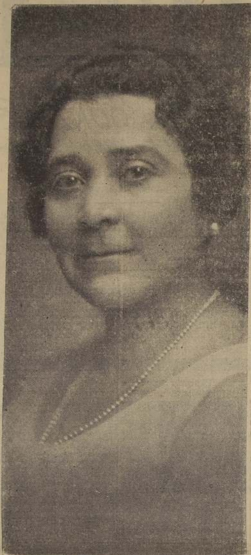
SEÑORA JUANA AGUIRRE DE AGUIRRE

Algunas damas que la acompañan agregan algunas palabras y ellas demuestran inmediatamente que la esperanza de la primera dama de la nación no es infundada. Las mujeres chilenas seguirán en la tarea de demostrar con la palabra y el ejemplo que el triunfo está de su parte, pues éste se encuentra siempre del lado del espíritu.