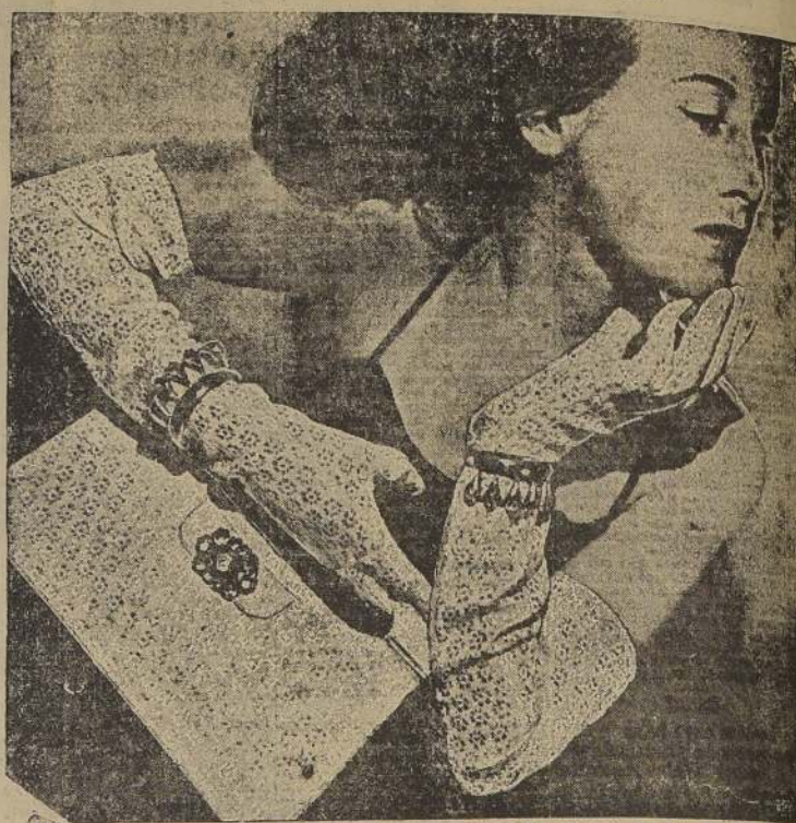
MAINBOCHER HA OREADO PARA LA NOCHE ESTE JUEGO DE GUANTES LARGOS Y CARTERA EN LANA DORADO. LOS BRAZALETES SON DE TURMALINAS ASI COMO EL BROCHE DE LA CARTERA.

Tan pronto como las mujeres argentinas tuvieron conocimiento de estos atentados a sus derechos se aproximaron a la comisión redactora y le expusieron sus quejas. Esta les escuchó atentamente y según hemos sabido, han recapacitado sobre algunos de sus acuerdos. Tal vez presenciar el efecto que producen sus acuerdos, sintieron vergüenza de haber pretendido volver a la Edad Media, a esa época en que los caballeros les cobraban a las mujeres cinturones de castidad y en que se efectuaban esos reconocimientos de virginidad de la recién casada.