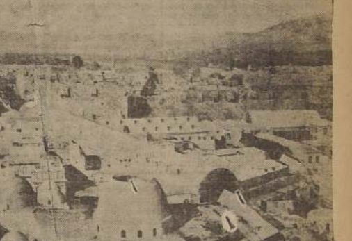
Panorama de Damasco

El plan de los rebeldes sería que la revuelta estallara en forma simultánea en las ciudades de Dumasco, Aleppo y Latakia