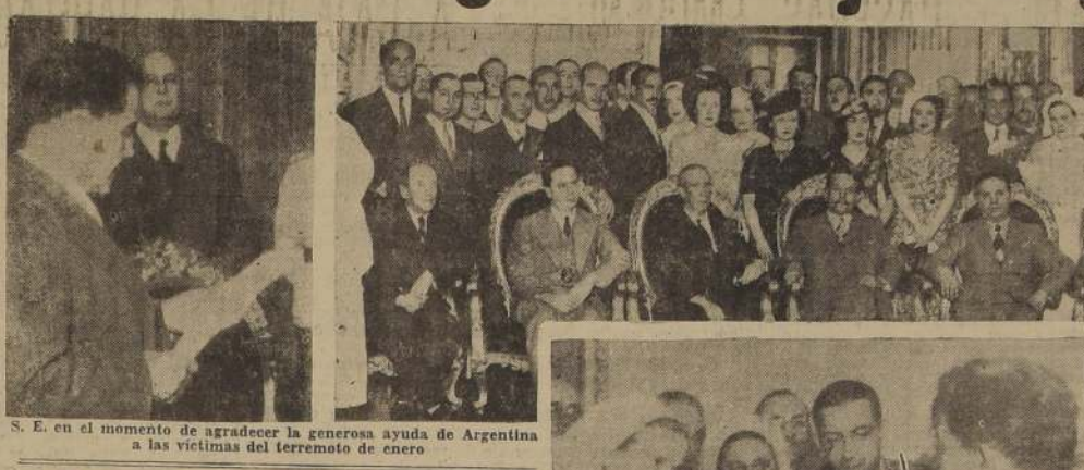
S. E. en el momento de agradecer la generosa ayuda de Argentina a las víctimas del terremoto de enero

HOY SE DESPEDIA DE S. E. EL NUEVO CONSUL EN B. AIRES