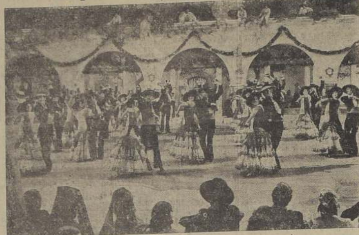
Danzas y canciones típicas del viejo México animan y embellecen esta creación de Jeannette MacDonald y Nelson Eddy

En las funciones de matinee, tarde y noche, bajo localidades numeradas, el próximo lunes el Teatro Metro presentará el es- treno en Chile de la obra mu- nicipal “Bajo el cielo del oeste”, creación de la aplaudida pareja de grandes cantantes Jeannette MacDonald y Nelson Eddy. Esta producción Metro Gold- wyn Mayer, ha sido adaptada de la famosa obra teatral de David Belasco que se ha mantenido durante largos años en cartel por los escenarios más conocidos de Broadway. Llevada a la pan- taña la obra de Belasco, bajo la sabia dirección de Robert Z. Leonard, ha adquirido una ma- yor vida, un mayor movimiento y una mayor belleza.