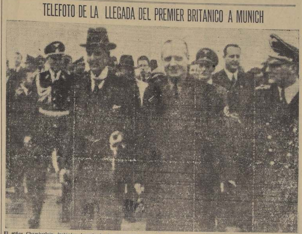
TELEFOTO DE LA LLEGADA DEL PREMIER BRITANICO A MUNICH

ABANDONE A LOS SUOS. PRAGA, 16.—(U. P.)—Se ordenó a las autoridades locales que abandonen a los sudetes a su suerte. La situación es tan grave que se teme que a fines de la semana próxima estalle el conflicto bélico que Checoslovaquia está moviendo todas sus fuerzas. Continúa el avance de los sudetes hacia territorio alemán.