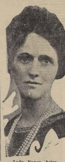
Lady Nancy Astor

ESTAMBUL, 17. — (U. P.). En el que en una ocasión fué el harem más grande del mundo, se reunirán mañana mujeres de cuarenta y dos países distintos, incluyendo representantes de los Estados Unidos. Rodeadas de objetos simbólicos de sus causas, estas mujeres delegadas a la Alianza Internacional del Sufragio Femenino, exigirán el reconocimiento de la igualdad de la mujer con el hombre. Este será el duodécimo Congreso anual que celebrarán. Es digno de hacerse notar que Turquía, el último país que abriera sus puertas al sufragio femenino, ha sido