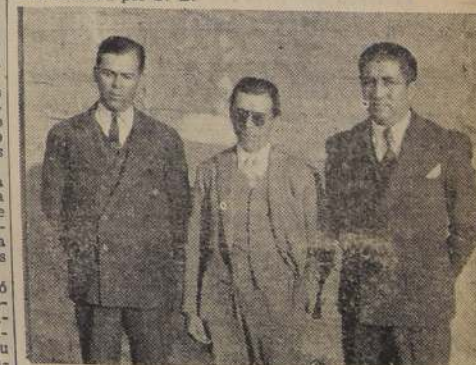
Los representantes del Sindicato de Propietarios de Autobus, en "LA NACION"

Después de terminada la entrevista, la comisión aludida visitó este diario, donde nos manifestó que estaba muy complacida de la acogida que había encontrado en el Presidente de la República y de la cordialidad con que había sido recibida por S. E.