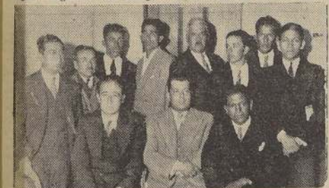
La delegación de Coquimbo en su visita a "LA NACION".

NUÉVAS DELEGACIONES Ayer llegaron las delegaciones de Coquimbo en su visita a "LA NACION".