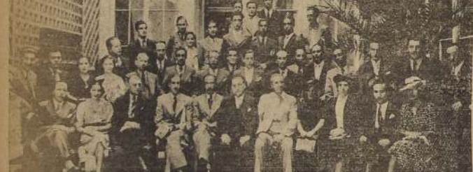
Asistentes a la asamblea en que el Sindicato de EE. de los Servicios de Vestuario del Seguro Obligatorio acordó solicitar el pago de gratificaciones pendientes y eligió Comités de Fiestas y Deportes