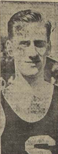
Guillermo García Huidobro, que igualó el record sudamericano de los 800 metros