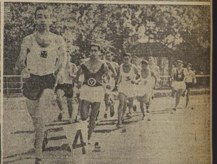
que igualó el record sudamericano de los 800 metros

Ha sido suspendido el lance con el Seleccionado de Viña del Mar, para nueva fecha