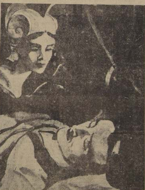
...Su médico vió en sueños a la diosa Minerva.

volvió del campo de batalla se encontró con que los malhechores habían pillado su tienda y dado muerte a cuantos en ella se encontraban.