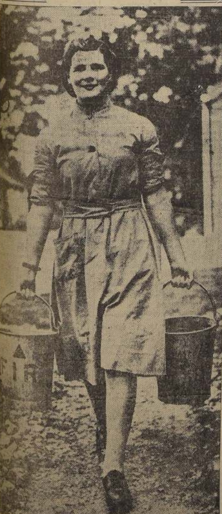
Mary Churchill, de 18 años de edad, hija del Premier británico, pertenece al Servicio Territorial Auxiliar de Gran Bretaña.

En 1939, antes de estallar la guerra, la población de la Alemania Magna consistía en poco menos de 80.000.000 de individuos de los cuales eran varones 38.812.032. En dichas cifras se hallan comprendidos los habitantes de Austria, que Alemania se anexó en la primavera de 1938, y los de la región checoslovaca que se anexó en el otoño de ese mismo año. Pero la ocupación militar de doce países más ha venido a plantearle a Alemania el problema de mantener su autoridad sobre pueblos que en junto suman más de 161.000.000 de individuos. Los doce países de que se trata son Checoslovaquia, Polonia, Dinamarca, Noruega, Bélgica, Holanda, Luxemburgo, Francia, Rumania, Bulgaria, Yugoslavia y Grecia.