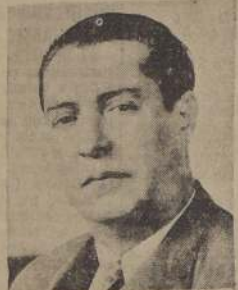
Candidato a senador, Provincia de Santiago