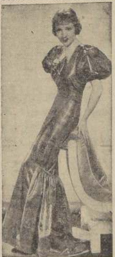
Claudette Colbert, quien denunció a una compañía de licores, estableciéndole pleito por haber usado su nombre para un anuncio sin autorización.