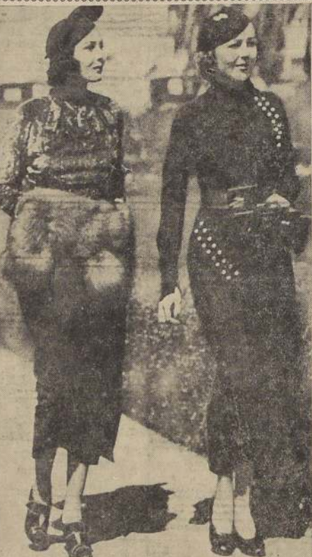
LAS HERMANAS RAQUEL Y RENEE TORRES, estrellas de la pantalla, se pasean en San Diego, California, por la villa española y demás contornos, mirando los preparativos que allí se hacen para la próxima Exposición Internacional del Pacífico que se inaugurará a fines del mes de mayo en aquella ciudad.