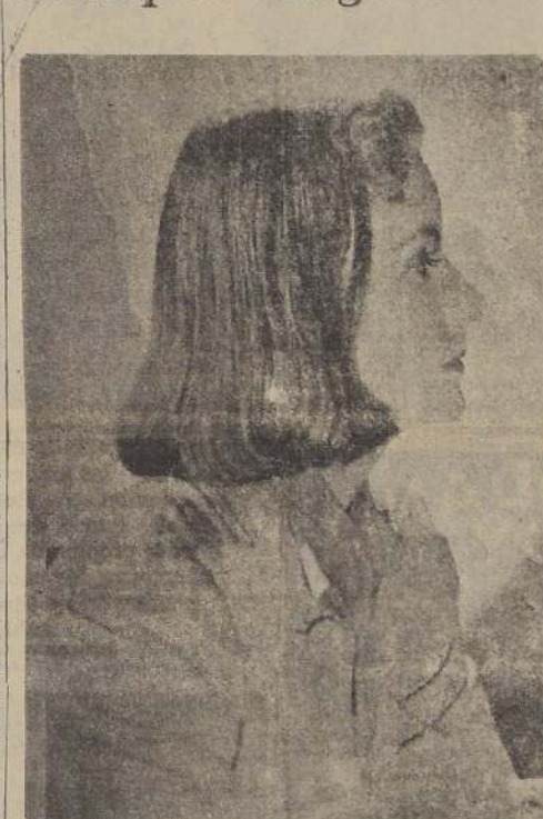
Greta Garbo, la extraña y recordada actriz nórdica, que ha sido considerada la más grande intérprete cinematográfica de todos los tiempos