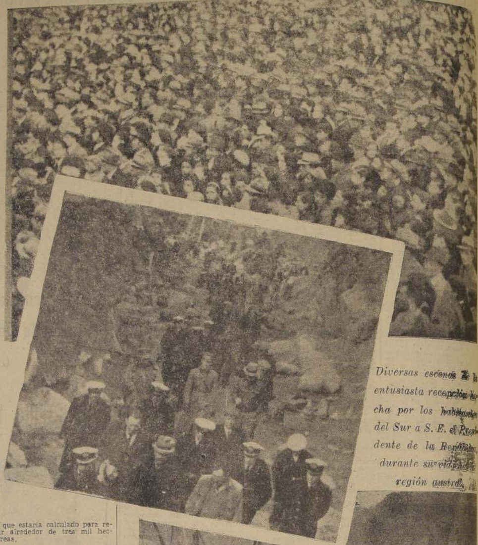
Diversas escenas de la entusiasta recepción hecha por los habitantes del Sur a S. E. el Presidente de la República durante su visita a la región austral.

En la mañana el "Sikorsky" partió con rumbo al Norte; pero, después de algunos minutos, tuvo que regresar a su base, debido al mal tiempo. Posiblemente se salga de nuevo mañana. (JOSE KRAMARENKO, corresponsal).