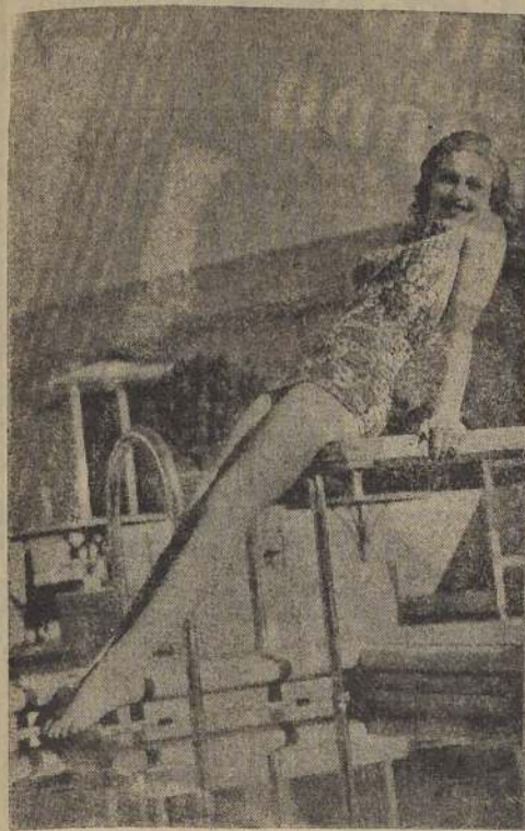
Lana Turner, escultural estrellita de Metro Goldwyn Mayer, no se decide a sumergirse en la piscina de su encantadora mansión de Beberly Hills