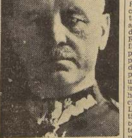
El general Sikorski, Comandante en Jefe de las Fuerzas Armadas de Polonia y Primer Ministro del Gobierno polaco establecido en Londres.