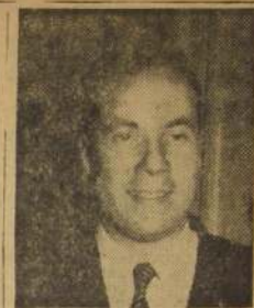
Diputado Eugenio Ballesteros, presidente de las Comisiones Unidas de la Cámara que estudiaron el proyecto económico.

El señor Rivera Baeza, de las Comisiones Unidas del Senado que resolvió los reajustes.