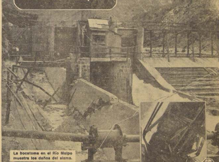
La bocatoma en el Río Maipo muestra los daños del sismo.

¡Hay que torcer el curso de un río! Aquí en la bocatoma de la Planta QUELTHUES, a 1.528 mts. sobre el nivel del mar, ubicada entre dos macizos de roca, el sismo de Septiembre último desplazó una ladera y "trituró" las obras de toma. ¡la caja del