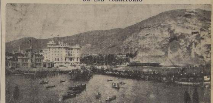
El puerto de Arica

LA CIRCUNSTANCIA QUE EL DEPARTAMENTO DE ARICA LIMITE CON LAS REPUBLICAS DEL PERU Y BOLIVIA, ACONSEJAN DAR UNA MAYOR IMPORTANCIA A LOS SERVICIOS ADMINISTRATIVOS Y JUDICIALES DE ESE TERRITORIO