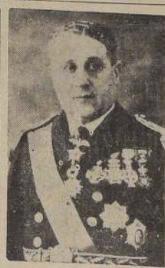
Vicealmirante don Julio Allard

"Los partidos políticos y todos los ciudadanos de la República pueden estar ciertos de encontrar en el Ministro una absoluta garantía para el honesto ejercicio de sus deberes, pero también serán inflexible para aplicar