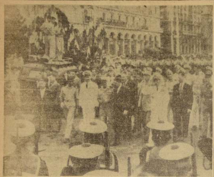
ARGENTINA.— Una guardia de marines franceses (primer plano) presenta armas al peso de un grupo de oficiales, durante una ceremonia ante el monumento de la Armada, que tuvo lugar aquí ayer. Al centro, con ropas de civil, Jacques Soustelle, el líder gaullista; a su derecha, el general Raoul Salan y el general de la Fuerza Aérea Edmond Jouhaux.