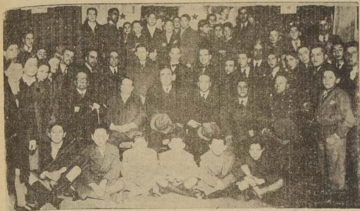
Asistentes a la recepción de ayer en el Bando de Piedad