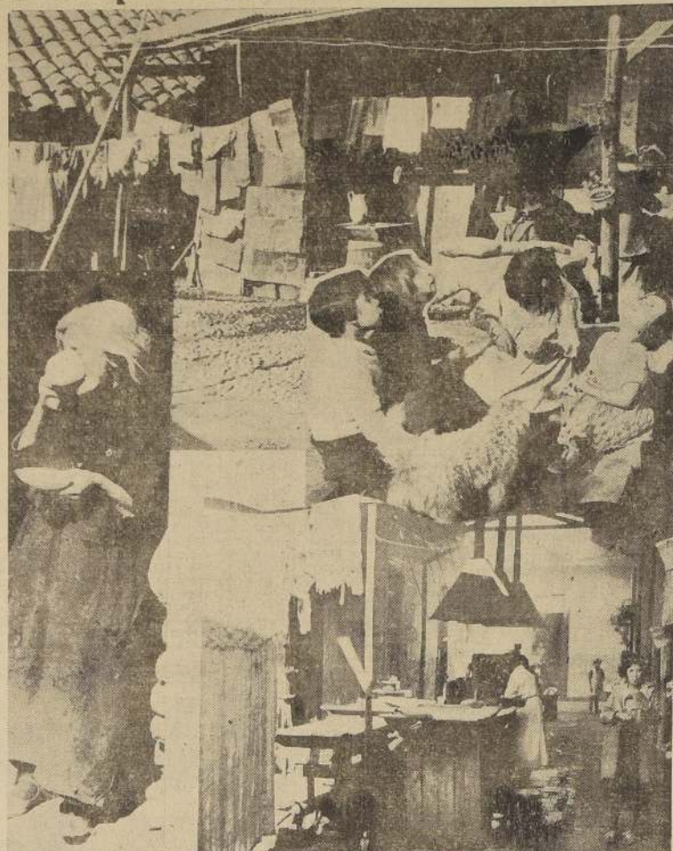
El problema de la vivienda popular reviste en nuestra ciudad especiales caracteres de gravedad, dado el alto precio alcanzado por los arriendos en los últimos meses, y la ausencia de condiciones higiénicas que se advierte en las habitaciones.

—Green ustedes que con esta plata puede vivir una