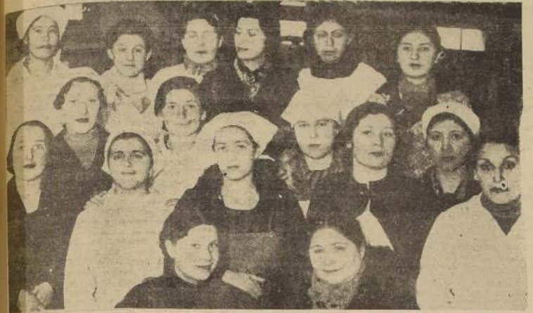
Alumnas del Curso de Economía Doméstica que mantiene el Depto. de Bienestar del Ejército

Una fecunda labor realiza la Sección Médico-Social. — Organización de un curso de economía doméstica para el personal. — Cooperación de diversas instituciones