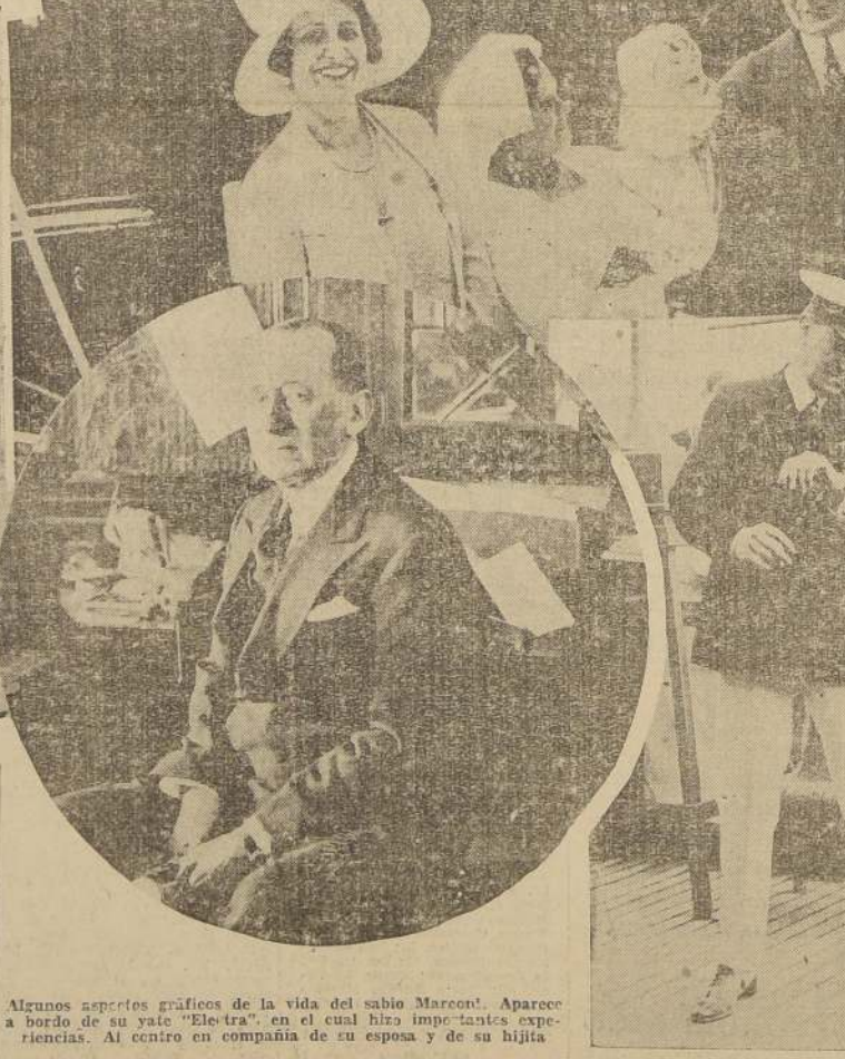
Algunos aspectos gráficos de la vida del sabio Marconi. Aparece a bordo de su yate "Elettra", en el cual hizo importantes experiencias. Al centro en compañía de su esposa y de su hija.

PASO SU VIDA DES CUBRIENDO SECRETOS DE LA NATURALEZA