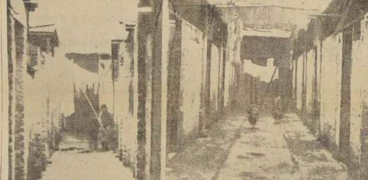
Interior del conventillo "El Chiflón del Diablo" uno de los de más triste fama de nuestra ciudad

El grabado muestra cuatro aspectos de lo que son nuestros conventillos, acerca de lo cual trata