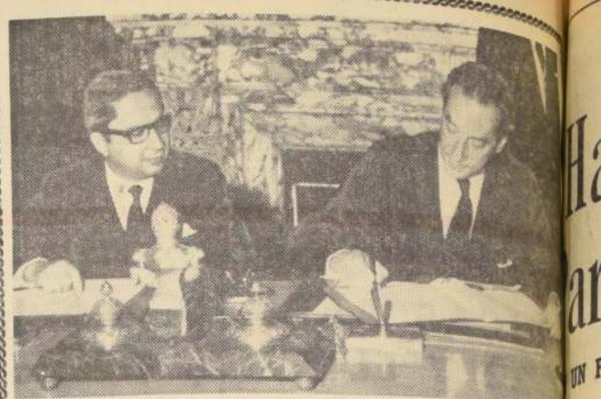
Ayer al mediodía, en el Salón Rojo del Ministerio de Relaciones Exteriores, el Canciller Gabriel Valdés y el representante del Banco Interamericano de Desarrollo, Cleantho de Paiva Leite, firmaron el Convenio mediante el cual se pone en marcha una oficina regional del BID en Santiago. EN EL GRAPADO, el Ministro y el representante del BID, Cleantho de Paiva Leite, quien se hizo cargo de la misión en Chile.

La política de desarrollo agrícola, en el marco de la CORFO, en el futuro, será la de impulsar la producción agrícola, mediante la adquisición de maquinaria agrícola, para el mejoramiento de la producción agrícola.