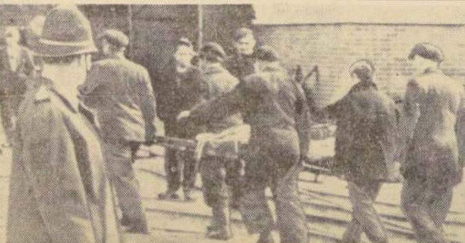
TONYPANDY, Gales. — Cuadrillas de rescate llevan el cadáver de un minero muerto en la mina de carbón, después que una explosión dejó numerosos trabajadores atrapados. Por lo menos treinta mineros se encuentran encerrados en un túnel de dicha mina y se teme por su vida.

En la última sesión extraordinaria, efectuada el viernes 14 de los corrientes, el presidente hizo una exposición detallada de los acontecimientos producidos en la ANDABA, asunto que se ha estado estudiando y su pronunciamiento oficial se efectuará esta noche. Se hace presente a las directivas de los clubes, para bien comenzar a nombrar a los representantes de la ANDABA, actuando en la competencia que dan origen a las competencias oficiales. Se hace presente a las directivas de los clubes, para bien comenzar a nombrar a los representantes de la ANDABA, actuando en la competencia que dan origen a las competencias oficiales.