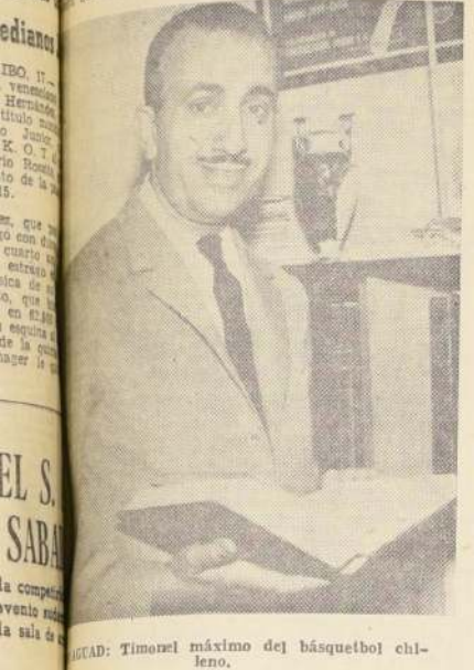
LUCA: Timonel máximo del básquetbol chileno.

La designación de estos países se efectuará tomando en consideración la pauta y reglamento que para estos casos entrega la FIBA (Federación Internacional de Béisquetbol Amateur) y existe unanimidad para señalar que serán muy pocas las modificaciones que se harán, con relación a la primera lista entregada y que habla de los campeones y vicecampeones de la última Olimpiada, del Torneo Mundial y de los actuales poseedores del cetro máximo en los diferentes continentes. Sólo existe dificultad para elegir entre Francia y España, países que han sido incluidos en la nómina, a petición de la FIBA. Sólo uno de ellos podrá participar.