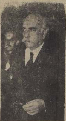
Excmo. señor J. Hortensio Quijano

BUENOS AIRES, 20.—(U. P.)—El Vicepresidente de la República, señor J. Hortensio Quijano, presidirá la delegación que irá a Santiago de Chile, para la asunción del mando presidencial, según se supo hoy en la Cancillería. El señor Quijano, y demás miembros de la Misión Extraordinaria, viajarán a bordo del acorazado "Moreno", que próximamente zarpará a Valparaíso.