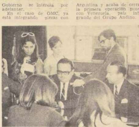
El Ministro de Economía, Enrique Krauss, durante la firma, ayer al mediodía, del decreto que autoriza a la empresa General Motors para fabricar automóviles y camionetas en nuestro país, rodeado de periodistas y de altos personeros de esa industria.