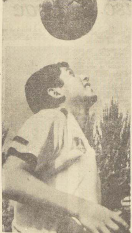
CHAMACO VALDES.— Busca rehabilitación.

Se encuentra en nuestro país, invitado por el Consejo Estudiantil Nacional el campeón de kárate, Seichi Akamine, quien es actualmente el más alto exponente de este deporte del Japón. El profesor Akamine, Cinturón Negro y octavo Dan—distinción máxima del kárate—dictará unos cursos para cultores e instructores, como parte de la campaña que se ha iniciado últimamente para la difusión de este deporte en Chile.