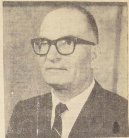
MINISTRO DEL INTERIOR, EDMUNDO PEREZ ZUJOVIC que dirigiéndose al país por cadena nacional de radioemisoras y televisión, clarificó la inflexible posición del Gobierno, en el sentido de resguardar el orden y la institucionalidad, como lo están avalando los antecedentes irrefutables que expuso en su discurso.

"ME DIRIJO CON SINCERA LEALTAD A TODOS LOS CHILENOS, PARA QUE MEDITEN EN EL FUERO DE SUS CONCIENCIAS SOBRE QUIENES RECAE LA RESPONSABILIDAD DE LOS HECHOS DOLOROSOS QUE EN ESTA OPORTUNIDAD COMENTAMOS"