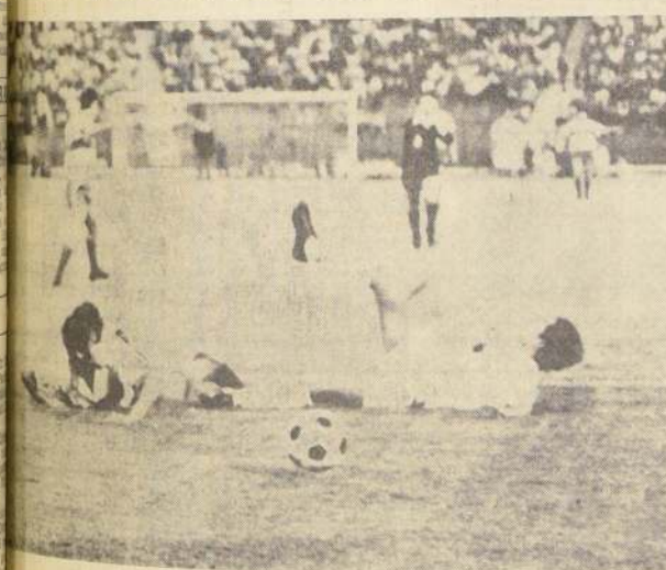
MISSEN desde el suelo reclama de la falta que ha sido víctima por parte de un peruano. Hubo varios brotes de juego brusco, que felizmente no llegaron a provocar una incidencia de pronociones.