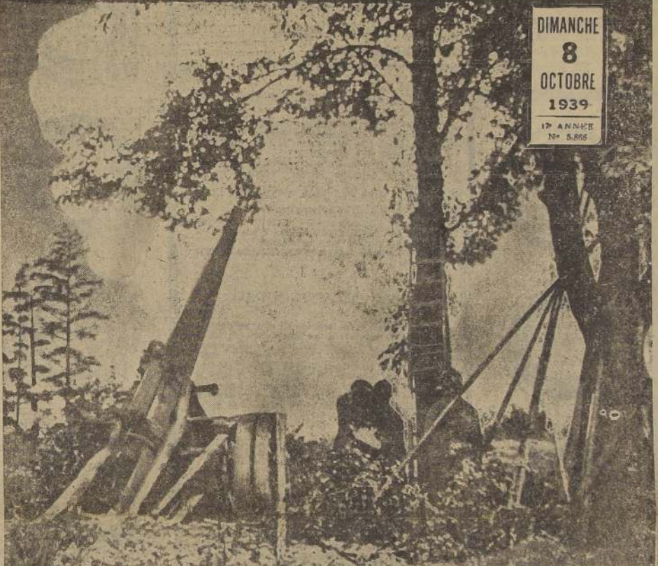
Vista tomada durante un intenso bombardeo de la artillería francesa contra las posiciones alemanas situadas a lo largo de la Línea Siegfried. Fue un verdadero diluvio de fuego y hierro que destruyó e hizo insostenibles las obras de defensa enemigas. (Fotografía reproducida en el diario "Paris-Soir", del domingo último, llegado a Santiago en el correo de Air-France)

DIMANCHE 8 OCTOBRE 1939 19 ANNEE N.º 5.866