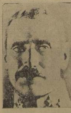
S. M. Cristian X