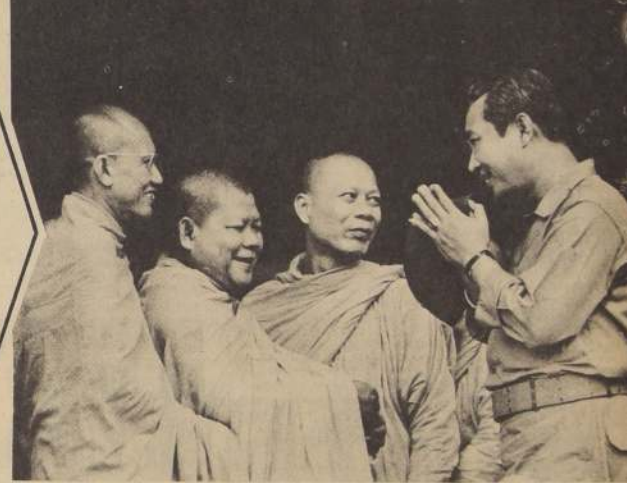
LON NOL, que ha asumido amplios poderes en Camboya

Varias comisiones de trabajadores visitaron hoy al capitán general del departamento naval y al alcalde de Ferrol para protestar contra la acción policial.