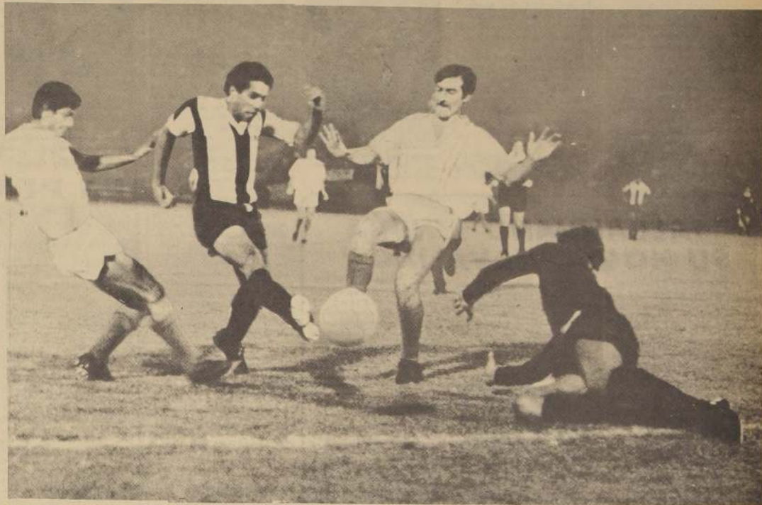
CON LA DECISION de costumbre, San Felipe afrontará el compromiso de esta noche frente a Universitario.