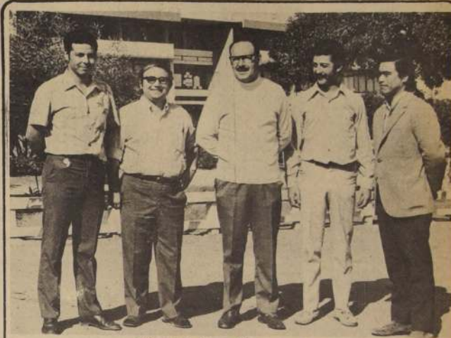
El Ministro de Minería, Mauricio Jungk, junto a Directivos de la Universidad del Norte, en su reciente visita a dicha casa de estudios.

AHUMADA 254 Of. 809 (horas de oficina) a contar del Lunes 13 al 20 marzo.