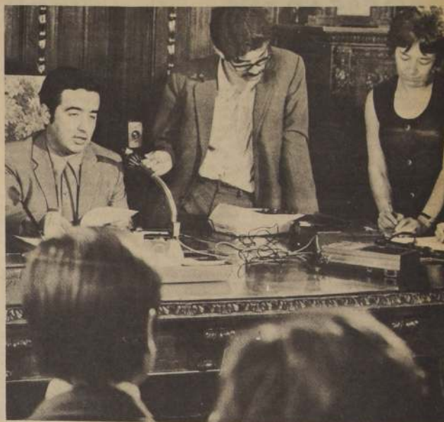
El Ministro del Interior, Hernán del Canto, en la conferencia de ayer.

División Carlos Prats González, quien ha solicitado que en la discusión política, tanto en los órganos de prensa como en las organizaciones partidarias, se excluya a las Fuerzas Armadas, que disciplinadamente están cumpliendo las tareas profesionales o institucionales que les ha encomendado el país.