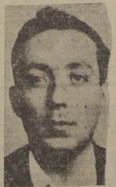
Justiniano Sotomayor Pérez Bio-Bio

A LAS JUNTAS PROVINCIALES Y ASAMBLEAS RADICALES DEL PAIS