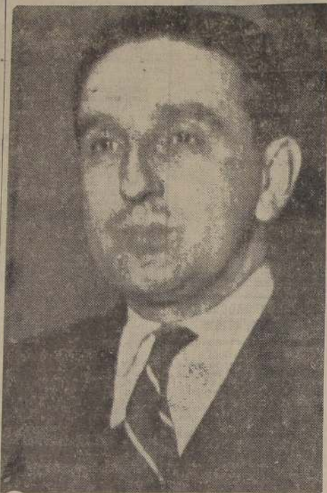
Presidente del partido, Don Pedro Castelblanco

cumplir sin reservas ni temores sus compromisos. Nadie puede señalar un solo caso en que hayamos menoscabado este Código de honor político. Aun a costa de sacrificios y a riesgo de perder magníficas situaciones, el Partido ha dado pruebas de gran lealtad y desinterés. Para nosotros, los pactos, las alianzas y los entendimientos recíprocos no son "simples pedazos de papel" sino documentos que comprometen la dignidad del Partido, haciendo honor a su larga y fecunda historia.