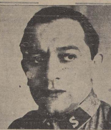
JOSE RODRIGUEZ CORTES, Secretario Nacional de Propaganda y candidato a Diputado por el III Distrito de Santiago, ocupará hoy el micrófono de la Radio Huckle de 21.45 a 22 horas.

Por su personalidad de destacado dirigente del socialismo chileno, existe expectación por escuchar su discurso. Rodríguez se referirá al momento político actual, y, al mismo tiempo, dictará las últimas instrucciones sobre el acto electoral del domingo.