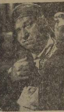
Wallace Berry, es uno de los principales personajes de "La isla del tesoro".

Docientos millones de muchachos en todas partes del mundo, muchos de ellos ahora hombres hechos y derechos, han leído "La isla del tesoro".