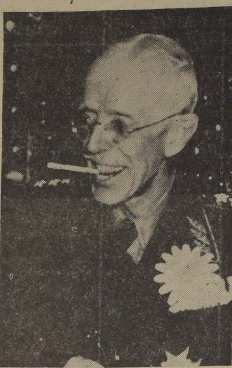
S. M. el Rey Gustavo de Suecia