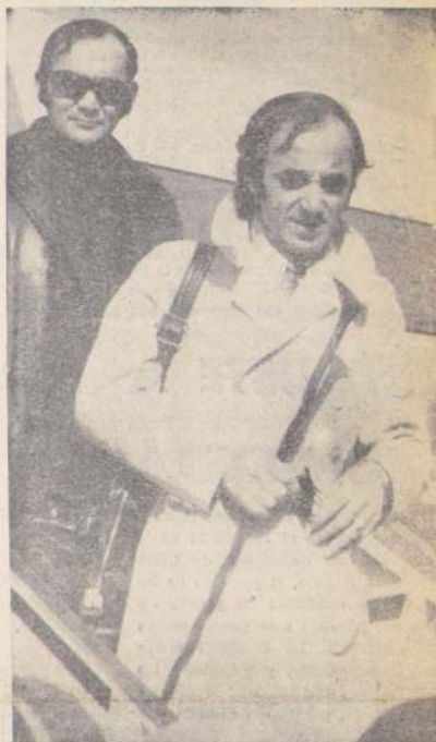
Charles Aznavour, cantante y cineasta galo, está de paso en nuestra capital. Llegó ayer y hoy continúa su viaje. Sus horas fueron plenas de actividad, filmación para la TV, contactos con cineastas chilenos, conferencias de prensa, etc.