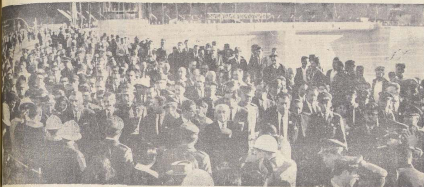
Un botón accionado por el Presidente Frei puso en marcha, en la tarde de ayer, las turbinas de la Central Hidroeléctrica Rapel, obra de ingeniería que permitirá acelerar el progreso del país, con una 350.000 KW de potencia. En el grabado, un aspecto de la imponente obra.

"Rapel", Trascendental Obra para el Progreso Nacional