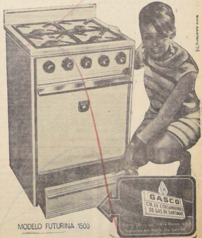
MODELO FUTURINA 1500

La cocina GASCO de cuatro platos MODELO FUTURINA 1500 con marcador de temperatura en el horno, se ha convertido en la mejor compañera de mi hogar (después de los niños y mi esposo). Vaya Ud. también cuanto antes a la sucursal GASCO de su barrio. Su cocina la espera. Y recuerde... "GASCO SABE MAS DE GAS"