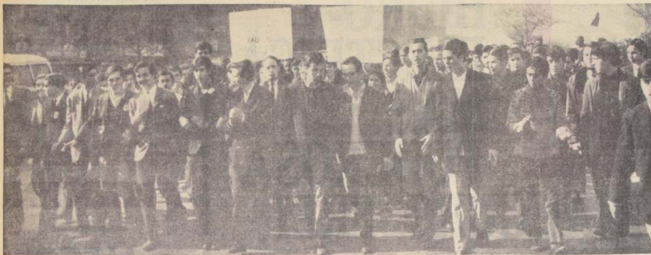
Dos mil estudiantes de la Universidad de Chile participaron en una concentración de apoyo a la Reforma Universitaria, organizada por la FECH. En el acto, efectuado en el Teatro Baquedano, hicieron uso de la palabra dirigentes docentes y estudiantiles. A la salida, los jóvenes marcharon en una columna por la Alameda hasta la Casa Central.