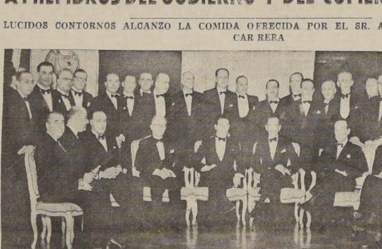
Asistentes a la manifestación