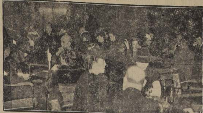
Aspecto parcial tomado en el Bar Central del Hotel Carrera