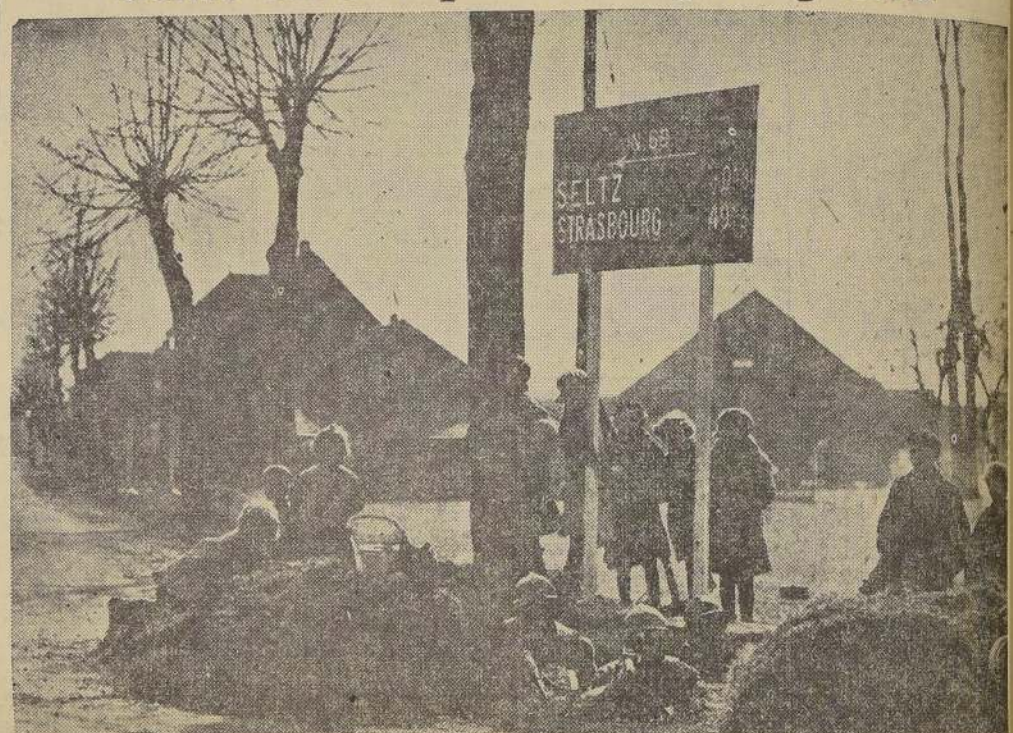
Los franceses han adoptado precauciones militares extraordinarias a lo largo de la frontera con Alemania. En todos los cruces de caminos pueden verse ametralladoras apostadas como se observa en el presente grabado