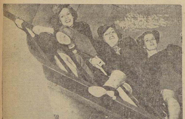
Las empleadas que trabajan en los rascacielos han afrontado alegremente las consecuencias de la huelga, y aquí las vemos descendiendo las escaleras en la forma en que solían hacerlo cuando pequeñas