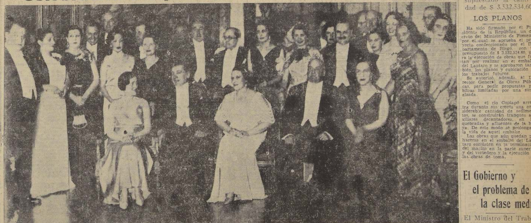
El Excmo. señor Alessandri, el Embajador Soriano y señora de Soriano, y distinguidas damas y personalidades que concurrieron a la recepción de anoche

Con singular entusiasmo y brillo continuó la recepción en la Embajada de España, donde se celebró el quinto aniversario de la proclamación de la República.