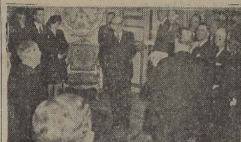
El Presidente Auriol recibe a un grupo de periodistas latinoamericanos en el Eliseo.