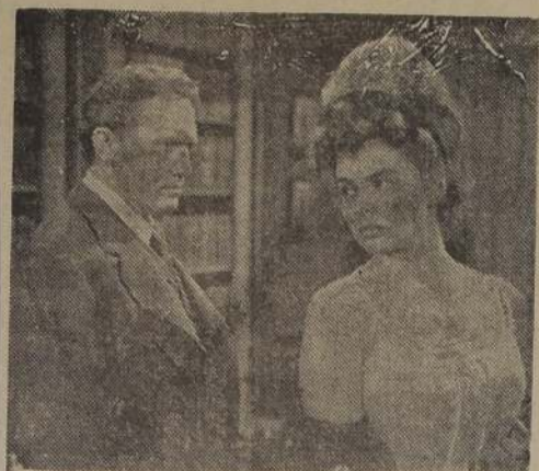
Ingrid Bergman y Spencer Tracy son los que aparecen en el grabado y los que animan también en los papeles principales de "El hombre y la bestia", una película de Metro Goldwyn Mayer, que se estrenará hoy en las funciones habituales del Teatro Metro.

UN MAGNIFICO REPARTO TIENE LA CINTA "EL HOMBRE Y LA BESTIA"