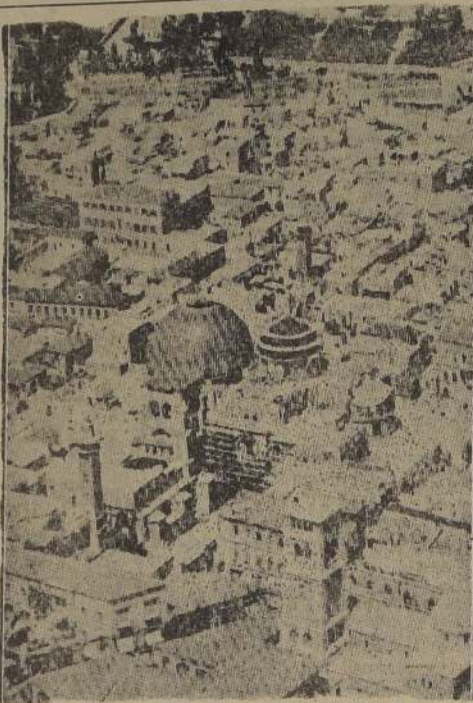
Vista aérea del barrio antiguo de Jerusalén.