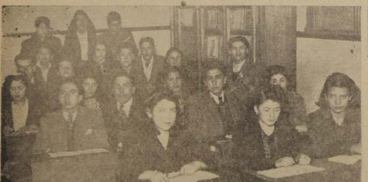
Grupo de alumnos y alumnas participantes en los cursos de la "Escuela Nocturna Augusto Villanova", que mantiene, con encomiable esfuerzo, la Sociedad Mutual J. M. Davila Baeza, en su local de San Francisco 668.— Los cursos, principalmente comerciales, corresponden a una plausible labor social y educativa de la prestigiosa organización.