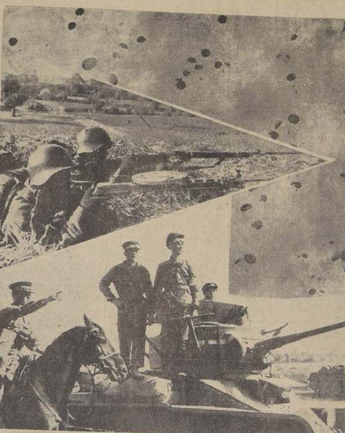
Soldados de caballería, tanques e infantería del ejército ruso. — Arriba, paracaidistas en pleno ejercicio.

Violentísimo bombardeo de los puertos de Kiel, Hamburgo y Bremen