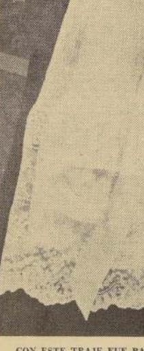
CON ESTE TRAJE FUE BAUTIZADA como hija de la Iglesia Católica, la Princesa Carolina Monaco, hija del Príncipe Rainier III y de la Princesa Grace. El vestido tiene el sello de la tradición familiar. Sirvió para presentar a su padre Rainier III ante el altar en un día semajante, y de su hija, la princesa Antonette. Esta realizada en organdi bordado en punto turco y adornado con encajes de valenciana. El traje seguirá guardándose para los futuros hijos de la pareja principessa de Monaco. Aunque con la venida al mundo de la pequeña princesa Carolina el susto de los monegascos de no tener herederos ya pasó.