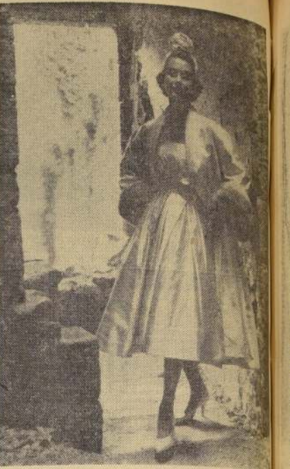
PARA LAS ELEGANTES. —Este ensemble, que MARY de París, bautizó como "Mallorin", fue presentado en el salón de invierno 1957. Lo forman un esmoquin vestido de raso, un traje de baño, un abrigo del mismo género, con puños de visón.