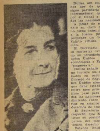
Golda Meir, Canciller de Israel, que dice cuenta al Parlamento de los últimos acontecimientos en el Medio Oriente.

CONCESIONES EGIPCIAS. — EL CAIRO, 2 (U. P.). — Funcionarios de las Naciones Unidas dijeron hoy en esta capital que Egipto hará algunas concesiones a las Naciones Unidas en su programa de explotación del Canal de Suez. El Ministro de Relaciones Exteriores, Mahmoud Fawzi, dijo hoy una visita al Embajador norteamericano.