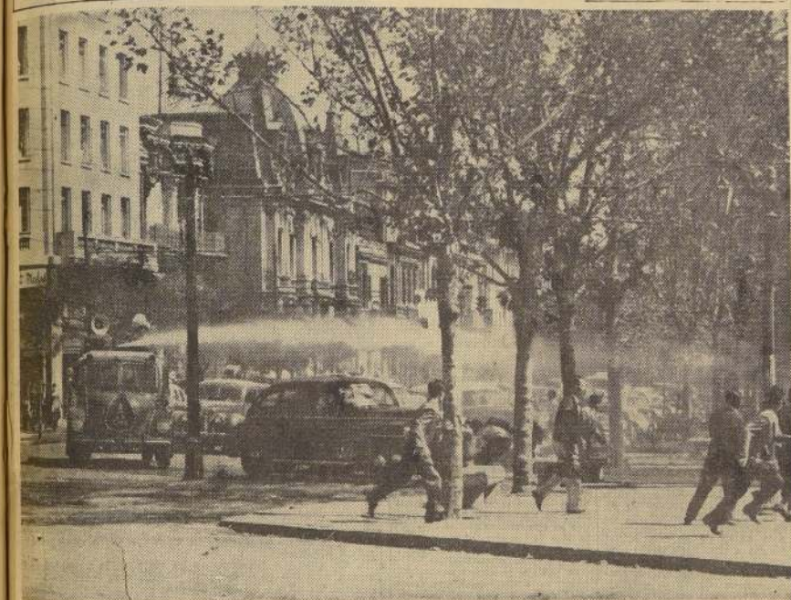
El carro lanza-agua de Carabineros apunta hacia un grupo de manifestantes que se había congregado en la Alameda Bernardo O'Higgins, impidiendo el libre tránsito de los vehículos de la circulación colectiva fiscal y particular. Los manifestantes huyeron o se refugiaron tras automóviles, bancos, monumentos, pero luego volvieron a reunirse y prosiguieron con sus gritos y demás acciones conjuntas de protesta.