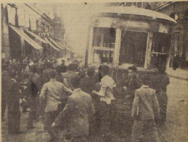
Un numeroso grupo de manifestantes se esfuerza por volcar un tranvía en la calle Agustinas casi esquina de Ahumada, en los incidentes ocurridos ayer al mediodía en el centro de la capital. A pesar del número, el carro se mantuvo en su posición normal hasta la llegada de la policía que procedió a dispersar a los manifestantes empleando bombas lacrimógenas.