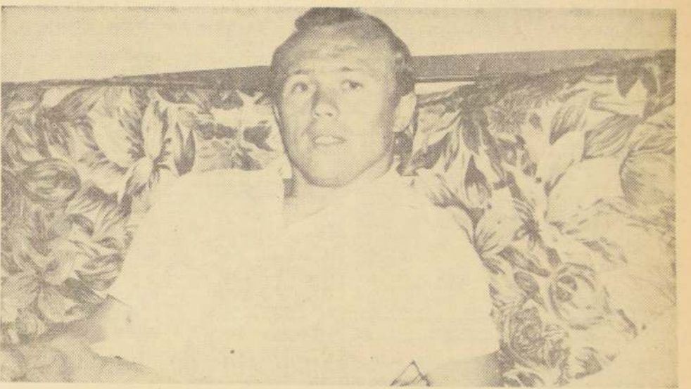
CON PASO FIRME avanza hacia las finales del Mundial de Londres, el excelente medizagüero Jan Geleta, de la Selección de Checoslovaquia, que tan brillante actuación ha tenido en el Hexagonal.