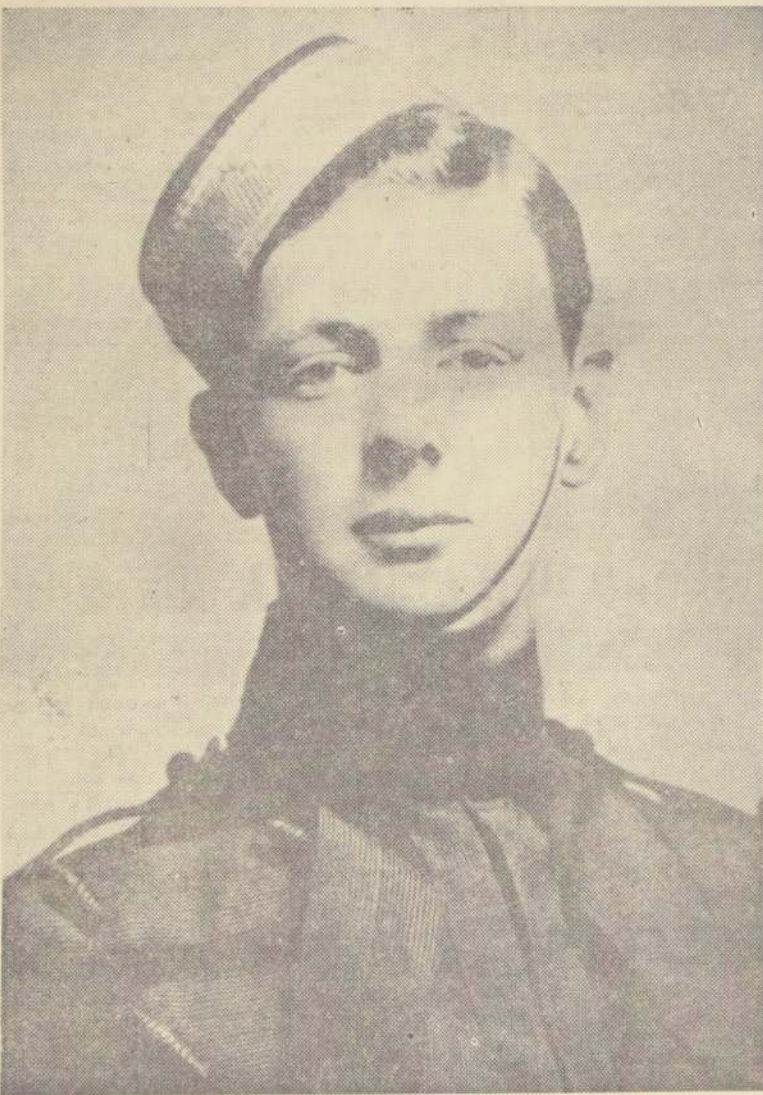
ESTA FOTOGRAFIA de Churchill fue tomada cuando tenía solamente 15 años, y era cadete en Sandhurst, donde su principal escollo para estudiar era el latín.

(*) Leema que el escudo lleva en español.