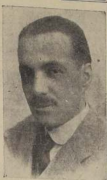
S. M. el Rey Carol II de Rumania, que cumple hoy 44 años de edad.