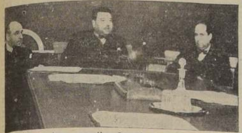
El profesor argentino durante su conferencia.

Disertó sobre la organización de la enseñanza técnica en su patria