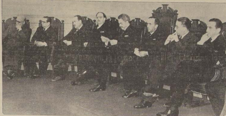
Mesa Directiva de la inauguración del Instituto Chileno-Cubano de Cultura.

Antillas no era un acontecimiento ajeno sino algo propio, porque con el advenimiento de Cuba a la vida soberana se sentía en el Mar Caribe, por encima de las aguas turbulentas del Océano, un puente de unión entre la gran democracia latinoamericana, vigorosa y ejemplar, y las democracias latinas de las Repúblicas centro y sudamericanas que bregan fuertemente por perfeccionarse dentro de un abierto espíritu de cooperación. Cuba, con visión de su destino superior y americanista, es un núcleo de pacífica interpenetración de ambas modalidades de la