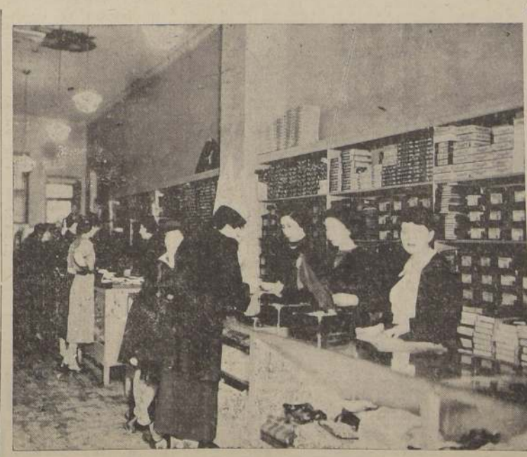
Interior de "La Reina de las Medias", Ahumada 360.

"Pero díganos — preguntamos — ¿cuántas personas entran diariamente a hacer sus compras en La Reina de las Medias?"