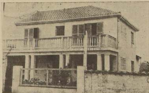
Residencia del constructor señor Gregorio Gálvez, Avenida Buzeta 560

Cada vivienda contará con un sitio de más de 100 mts.2. MATERIALES EMPLEADOS La mayor parte de los materiales empleados en la construcción de esta importante obra son de primera calidad. Tenemos, por ejemplo, las puer-