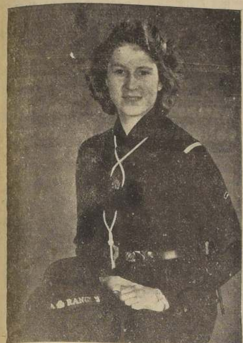
Su Alteza Real, la Princesa Isabel, heredera del Trono Británico con su uniforme de las "Sea Rangers"

Celebra oficialmente hoy su 18.º cumpleaños