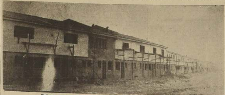
Primer grupo diagonal a la entrada de la Población Buzeta

LA CONSTRUCCION DE LA POBLACION "PEDRO AGUIRRE CERDA" CONTRIBUIRA NOTABLEMENTE AL ADELANTO DE LA LOCALIDAD. — LA POBLACION LINEAL. — VIVIENDAS MODERNAS PARA DOS MIL PERSONAS. — NECESIDADES DE LA COMUNA: AGUA POTABLE Y ALUMBRADO. — INTERESANTES PORMENORES