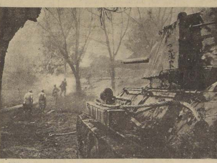
Infantería rusa avanza sobre las posiciones alemanas, bajo la protección de los tanques

ESTOCOLMO, 20. — (U. P.). — La Agencia Telegráfica Escandinava, en un despacho de Oslo, informó que una espantosa explosión ocurrió en la rada de Bergen. (Se supone que se trata del polvorín alemán). Dice que hasta ahora hay 43 muertos y centenares de heridos.