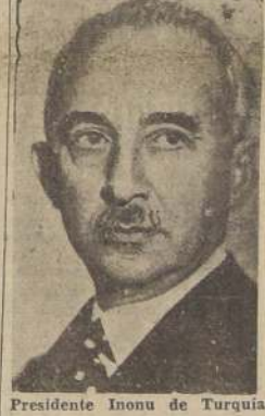
Presidente Inonu de Turquía