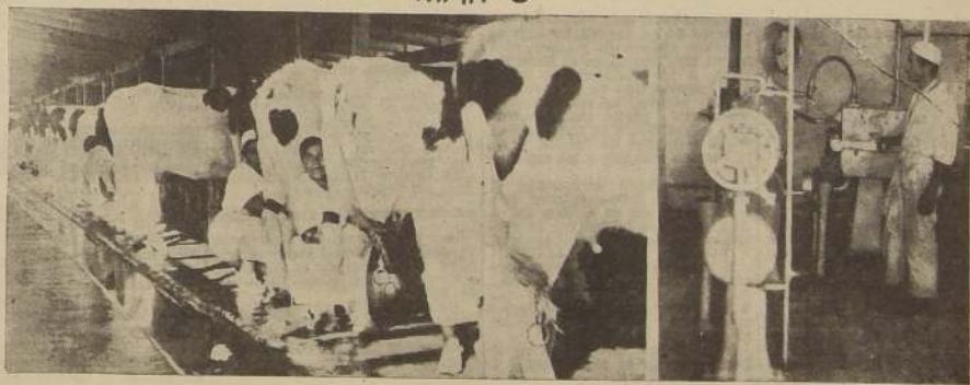
Vista de una parte del establo