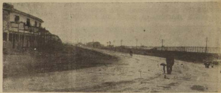
Aspecto de las hermosas avenidas de la Población, totalmente pavimentadas

tas y ventanas, de madera que son de la acreditada marca Fenix, establecimientos que desde hace años vienen suministrando estos materiales en las más importantes obras, con muy buenos resultados, por lo que ha logrado un justificado prestigio. La hojalatería total