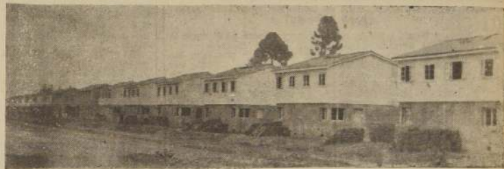
Estado actual de los trabajos de la Población "Pedro Aguirre Cerda". Aspecto de un grupo