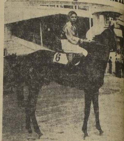
Brooklyn, ganadora de la prueba condicional para ganadora del Hipódromo Chile