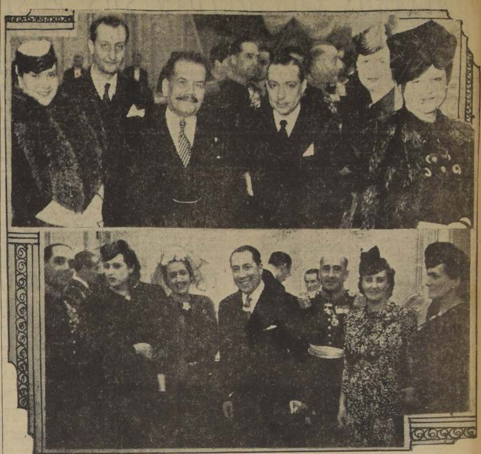
Los aspectos de la brillante recepción ofrecida ayer en la Moneda a los miembros del Cuerpo Diplomático, por el Excmo. señor Pedro Aguirre Cerda y señora Juana Aguirre de Aguirre, con motivo del aniversario de la independencia nacional.