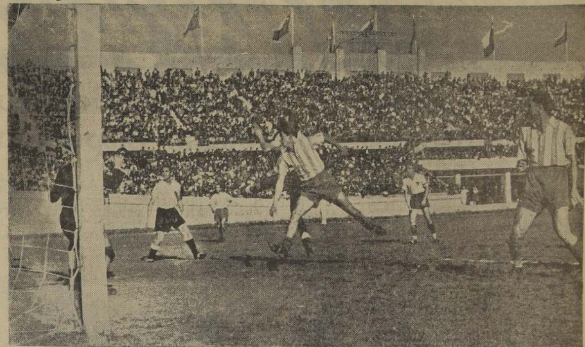
En uno de los sucesivos ataques de Racing, Godoy remata con un cabezazo que resulta desviado

REGUIERO.—Jugó 10 minutos, con poco éxito, mientras se reemplazó a Pila. No se orientó.