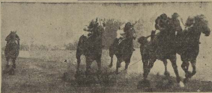
Nuestra favorita Brooklyn vence estrechamente a Colliguay, Meteoro y Nocturno