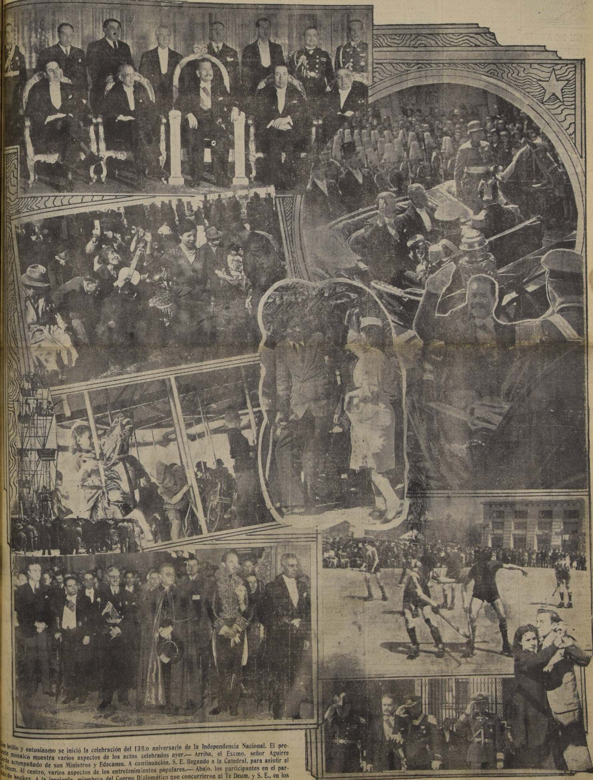
Con brillo y entusiasmo se inició la celebración del 130.º aniversario de la Independencia Nacional. El presente mosaico muestra varios aspectos de los actos celebrados ayer.— Arriba, el Excmo. señor Aguirre Gerda acompañado de sus Ministros y Edecanes. A continuación, S. E. llegando a la Catedral, para asistir al Te Deum. Al centro, varios aspectos de los entretenimientos populares.— Abajo, los participantes en el partido de hockey. A la izquierda, miembros del Cuerpo Diplomático que concurrieron al Te Deum, y S. E., en los momentos de dirigirse a la Catedral.