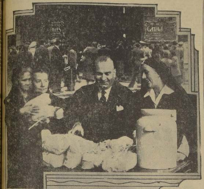
Un aspecto del reparto de raciones efectuado en la mañana de ayer en Gath y Chaves, a cargo de las socias de la Cruz Roja de Chile

En la Plaza Bulnes, a las 10 horas, se efectuó una función de misioneros, que también fue presenciada por una crecida multitud.