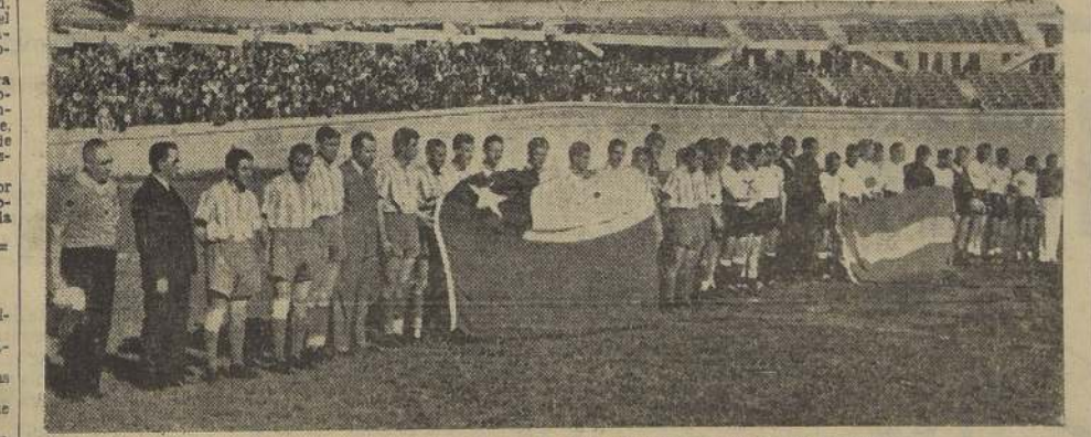
Los dos equipos del match internacional durante la ceremonia del izamiento de las banderas

En efecto, Racing derrotó a la selección porteña por 4 tantos contra 3, después de haber perdido el primer partido por 1 a 0 y en el match de revancha jugado ayer logró imponerse por igual score.