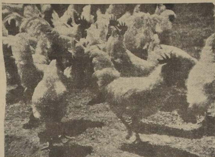
Gallitos reproductores de pedigree, de notable desarrollo, obtenidos por el buen régimen de alimentación

Cuando se dispone de espacio suficiente y lo permite la calidad del suelo, la obtención de pastos verdes durante todo el año es un factor decisivo en el éxito de una crianza avícola.