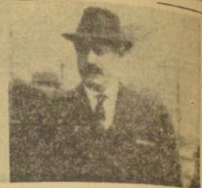
RAOUX SALAN, o el nacionalismo patológico

El general Salan, ante el tribunal que lo juzga en París por los crímenes de la OES, ha afirmado orgullosamente que el no es el jefe de una pandilla, sino de un ejército que no está derrotado, sino victorioso. Asimismo, ha asumido la plena responsabilidad por los demás infortunios de los sucesos argelinos. Aun a estas alturas no faltan en el mundo almas candidas que se emocionan con su gesto, que indudablemente, no carece de coraje.