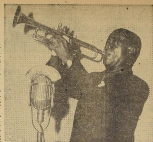
El seleccionado programa de variedades artísticas que ofrecerá la 2ª. Feria Industrial de ASIVA, en Playa Ancha, contará con la participación del famoso trompetista de color Louis "Satchmo" Armstrong, quien actuará en el escenario del velódromo Valparaíso, uno de los recintos de esta muestra.