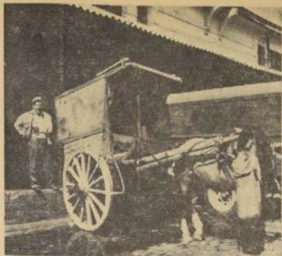
ELIMINARÁN CARRETONES.— El SNS ha notificado a los industriales del Matadero, que deberán ser eliminados los carretones a estas horas, debido a las condiciones mínimas sanitarias. En el traslado, uno de los carretones que actualmente hacen este trabajo en el Matadero de Santiago.