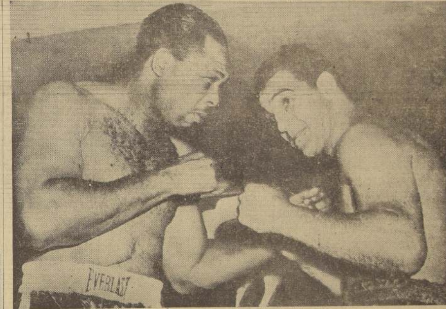
EN GUARDIA. — Nueva York. — El campeón de peso pesado, Rocky Marciano (derecha), y el retador Archie Moore, campeón liviano-pesado, se ponen en guardia después del pesaje de ayer. Marciano pesó 188 libras y Moore, 188. La pelea, que debió efectuarse anoche, fue suspendida hasta la noche de hoy a causa del mal tiempo.