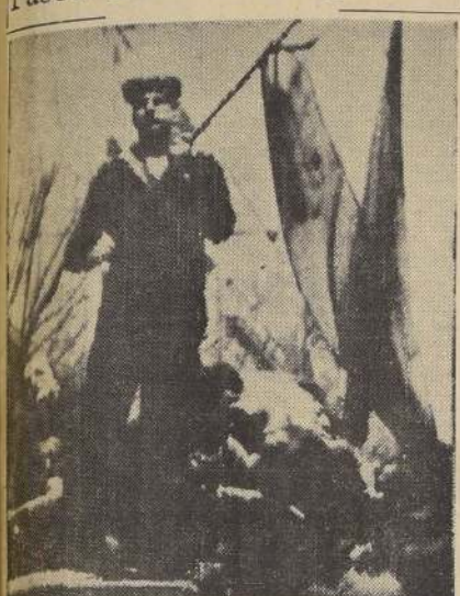
BUENOS AIRES.— Un jubilo marino hace ondear una bandera desde un automóvil, como manifestación de alegría por la renuncia de Perón.— (Radiofoto de la UNITED PRESS.)