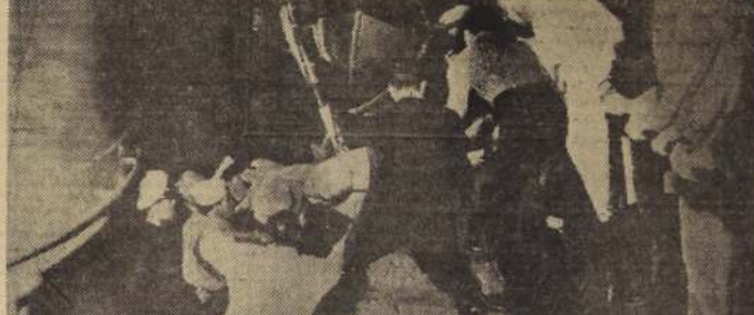
MONTEVIDEO.— Con gran cuidado y bajo la dirección de médicos uruguayos, un marino herido es sacado del destructor argentino "Cervantes", que se puso al lado de los rebeldes en la revolución argentina, y que llegó a este puerto el 16 de septiembre. El "Cervantes" y el cañonero "La Rioja" sufrieron bajas durante el ataque realizado por aviones leales, mientras los barcos se dirigían a Buenos Aires durante la rebelión.— Radiotele de la UNITED PRESS.

Habiendo a la prensa acerca de los acuerdos a que llegó hace una semana en Moscú con los gobernantes rusos, dijo: "Estos acuerdos no tendrán efecto alguno en nuestros planes de rearme, los cuales han de continuar desarrollándose regularmente como antes. Los acuerdos tampoco deben establecer diferencia alguna en los planes occidentales para la próxima Conferencia de Ministros de Relaciones Exteriores de Ginebra en octubre."