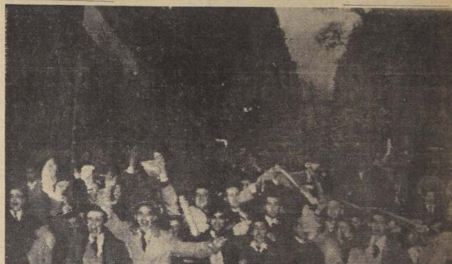
BUENOS AIRES.— Las multitudes en las calles se entregan a manifestaciones de júbilo, a raíz del anuncio hecho por el general Franklin Lucero, de que el Presidente Perón y todos los componentes de su Gobierno habían renunciado, como consecuencia del

últimatum de los rebeldes. El Ejército designó inmediatamente una Junta Militar de trece miembros, para atender los asuntos nacionales y negociar con los líderes de la revuelta, que tuvo cuarenta días de duración.