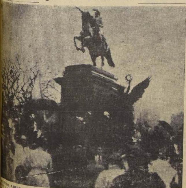
BUENOS AIRES.— Un grupo de ciudadanos se reúne frente al monumento al Libertador San Martín, luego de haber conocido la noticia de la renuncia del Presidente Perón. La lluvia torrencial no desanimó a los simpatizantes de los rebeldes, que se reunieron por las calles llevando banderas nacionales y dando gritos de "Viva Argentina".