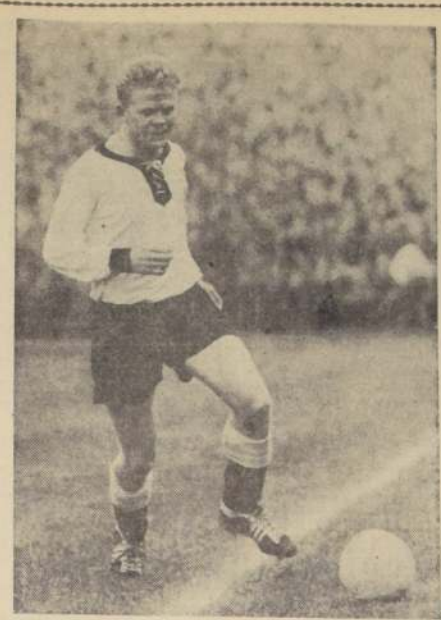
HELMUTH HALLER, insólito internacional de Bologna, conquistó el único tanto del partido jugado con Sampdoria, permitiendo su permanencia en el liderato del torneo italiano.