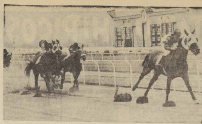
GRAN BATATAZO. GRAN: LIBERTINO. El hijo de Bonicatti que ha...

SEXTA CARRERA — LIBERTINO ganó la carrera, pagando 171.90 escudos. En la séptima carrera, el caballo de LIBERTINO ganó la carrera, pagando 171.90 escudos. En la octava carrera, el caballo de LIBERTINO ganó la carrera, pagando 171.90 escudos. En la novena carrera, el caballo de LIBERTINO ganó la carrera, pagando 171.90 escudos. En la décima carrera, el caballo de LIBERTINO ganó la carrera, pagando 171.90 escudos.