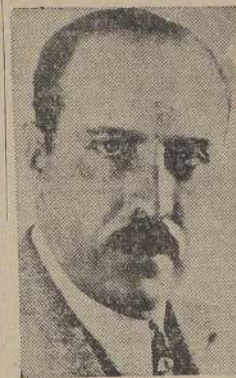
Presidente Arroyo del Río

GUAYAQUIL, 15. (U. P.) — Presidente de la República doctor Arroyo del Río acompañado de su comitiva, emprenderá mañana lunes viaje a Estados Unidos por vía aérea; su primera escala será en Cali, Colombia, y Oros países que visitará a su regreso.