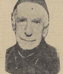
Monseñor Crescente Errázuriz

En la Catedral, a las 9 horas, se oficiará una gran misa con asistencia del Venerable Cabildo Metropolitano, de las dignidades eclesiales, del clero secular y regular.