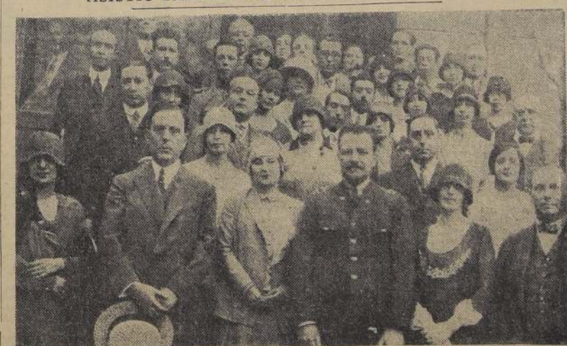
S. E. rodeado de las personas asistentes a la inauguración. En la tarde de ayer se efectuó, en San José de Maipo, la inauguración de la Casa de Salud "Carolina, Douglher de Tocornal", presidida por S. E.

ASISTIO TAMBIEN EL MINISTRO DE BIENESTAR