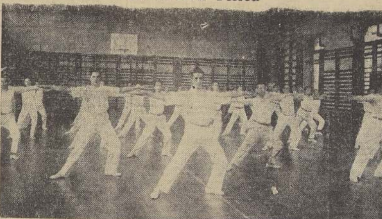
Durante una clase del primer curso de la Sección Hombres